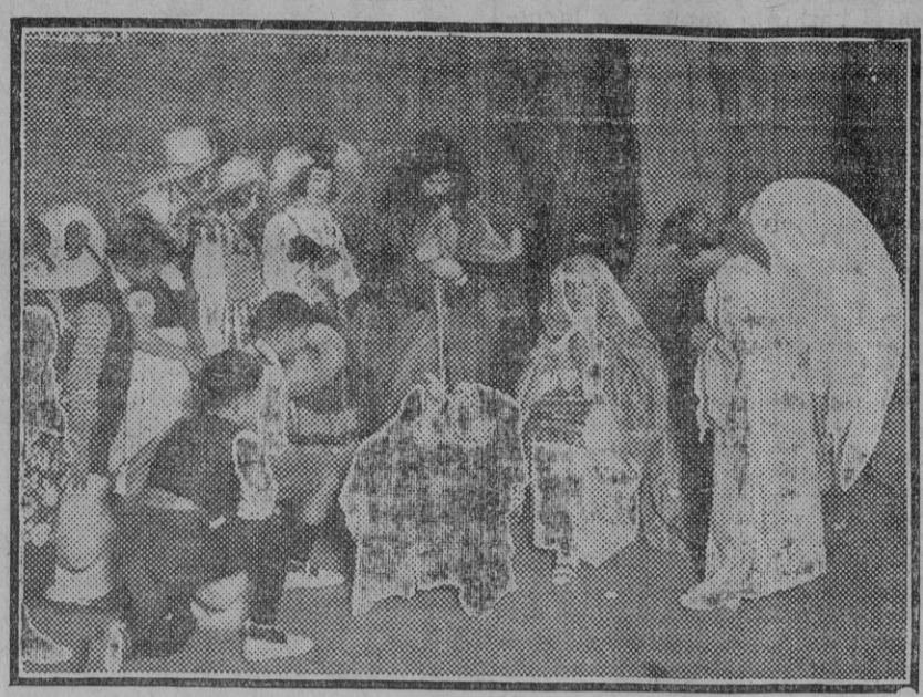
Una escena del boquete lírico 'El port de Bolén', representado por las alumnas de la Escuela Francesa con motivo de reparto de premios.