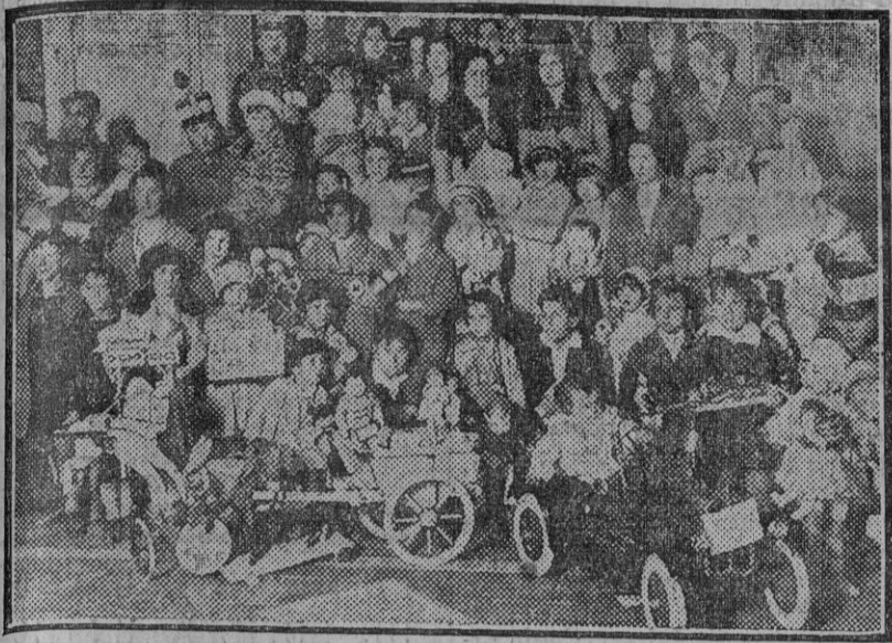
Grupo de pequeños, hijos de los suboficiales y clases de la guarnición de Sevilla, que ayer fueron obsequiados con un interesante festival y un valioso Arbol de Noel.

Suscripciones: SEVILLA: Un mes..... 2 ptas. PROVINCIAS: Trimestre..... 6 EXTRANJERO: Trimestre..... 15 Número suelto, 10 cts.