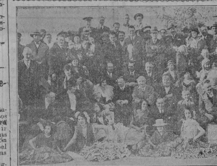
Los miembros de la Alianza Internacional de Turismo después de la fiesta típica con que fueron obsequiados ayer