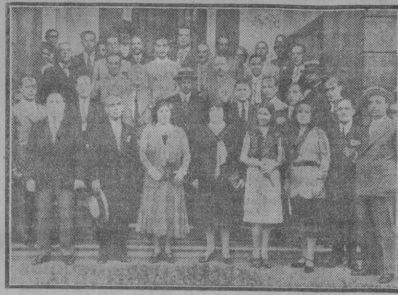
Los asambleistas de la Regional de Sastrea durante la visita hecha esta mañana al Ayuntamiento.

FABRICA DE CAMAS DE HIERRO Doradas y Niqueladas, Urquiza, sucesor JUAN MIRÓ ARROYO, 20 (próximo a la cochera de los Tranvías). -Exposición y venta con los últimos Modelos, abierta de 9 a 1 y de 3 a 7 PRECIOS ECONOMICOS