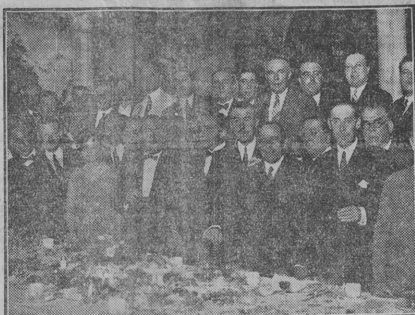
Las autoridades que anoche presidieron el banquete celebrado en honor de la Diputación provincial y un grupo de concurrentes al mismo.