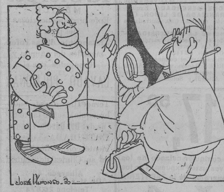
—Si todas las habitaciones son interiores, ¿por qué pusieron ustedes «sol» en el anuncio? —Verá usted; es que el dueño, a los huéspedes que son dóciles, les regala algunos domingos una entrada de sol para los toros.