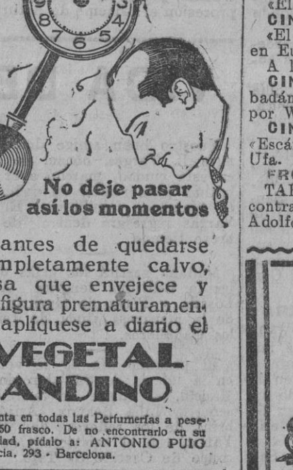
No deje pasar así los momentos

Pathé Baby a plazos de 20 pesetas mensuales—Bicicletas Esterly y Peugeot, hasta 20 meses de plazos—Gramófonos a 15 pesetas al mes. Crédito Bilbaino. - Sevilla Adriano, 24. Teléfono 24.580