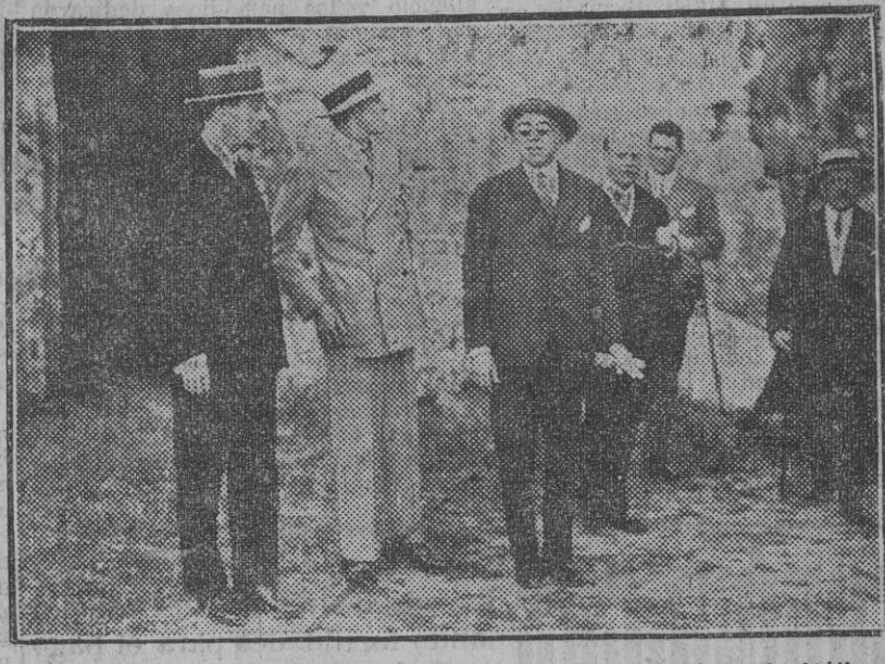
El príncipe de Asturias durante su visita a las Ruinas de Itálica.

Una agraciada joven ingiere gran cantidad de sublimado corrosivo, encontrándose en grave estado