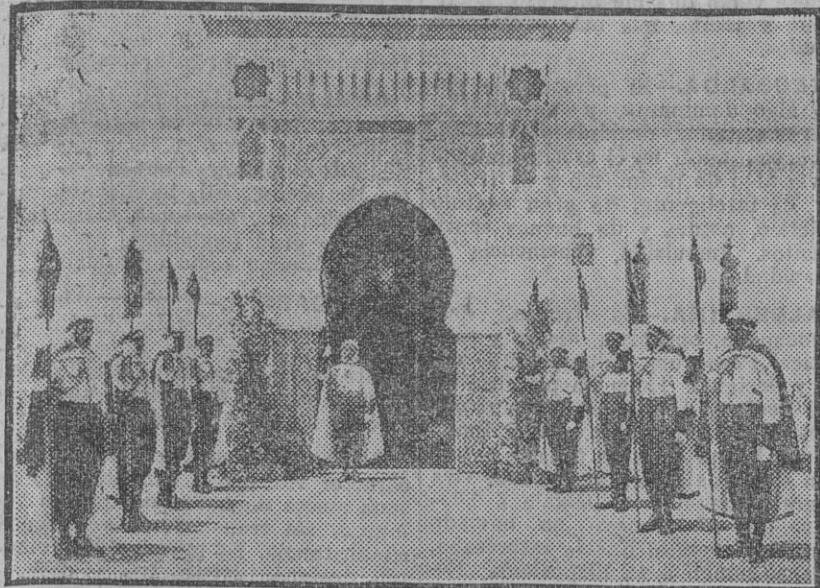
La guardia jalfiana, que se encuentra en Sevilla con motivo de la semana de Marruecos.

SEVILLA: Un mes..... 2 ptas. PROVINCIAS: Trimestre..... 6 » EXTRANJERO: Trimestre..... 15 » Número suelto, 10 cts.