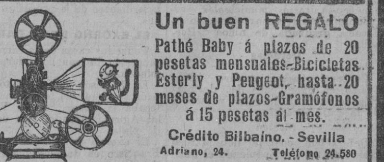
Un buen REGALO