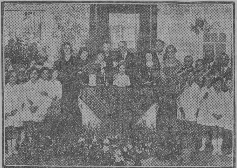
Inauguración de una Cantina y Ropero en la Escuela nacional de la calle Castilla, 157.