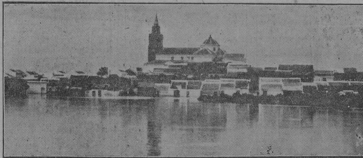
Aspecto de Los Palacios durante las recientes inundaciones