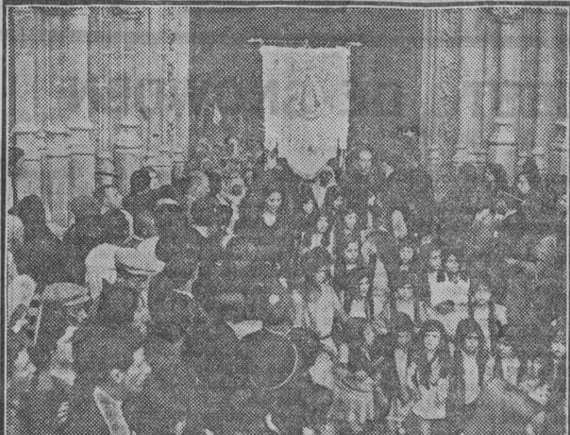
Un detalle de la procesion de ayer.

Con gran solemnidad se celebró esta mañana, a las diez, en el templo del Salvador la inauguración de la Asamblea Eucarística Regional. El altar mayor apareció cubierto con ricas cortinas de terciopelo rojo con mecas de oro.