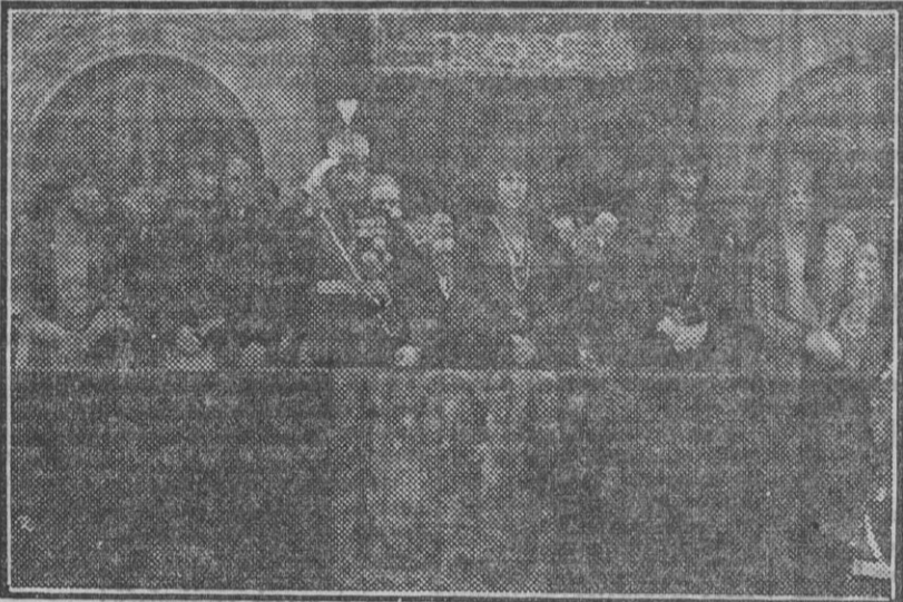
Los Reyes presenciando el desfile de las Cofradías desde la tribuna de la Plaza de San Francisco

Los amigos, los conocidos, nos van dando detalles interesantes para la información del día. Los trenes—nos dicen—han venido abarrotados, y anoche durmieron en los vagones algunos viajeros.