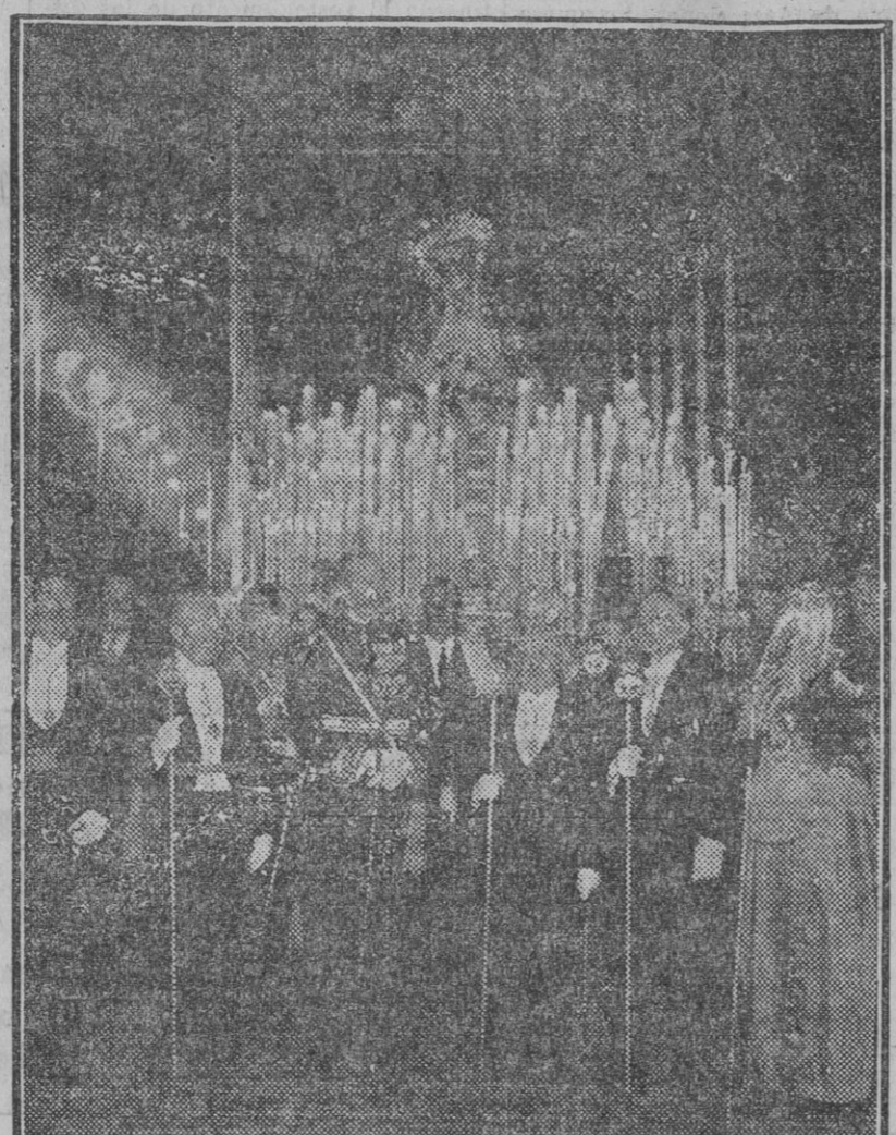
S. M. el Rey presidiendo el «paseo» de Nuestra Señora de la Victoria, de la Cofradía de las Cigarreras, de la cual es hermano mayor

De la maestría y habilidad con que realizaron estas operaciones, da idea el hecho de que en las casas de occorru próximas al lugar del siniestro no se prestase auxilio a ninguno de los vecinos de la casa siniestrada.