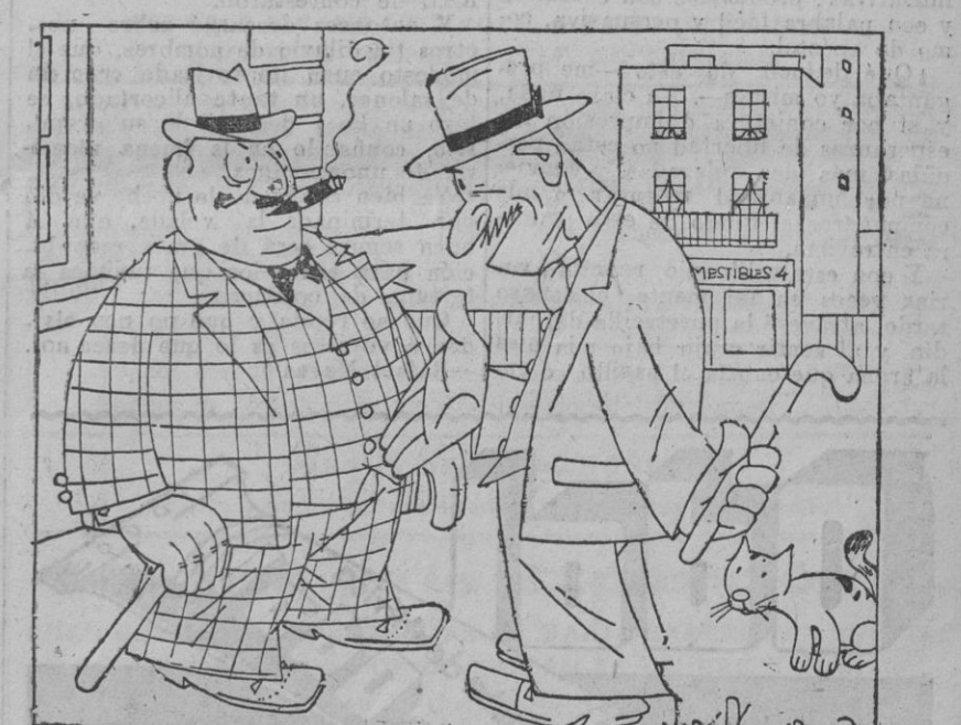
—De modo que usted no es partidario del cine parlante? —Figúrese. Yo que no iba al cine nada más que pasar un rato sin oír á mi charlatana mujer...

Los números de nuestros teléfonos son: Redacción . . . 25.348 Administración . 26.367