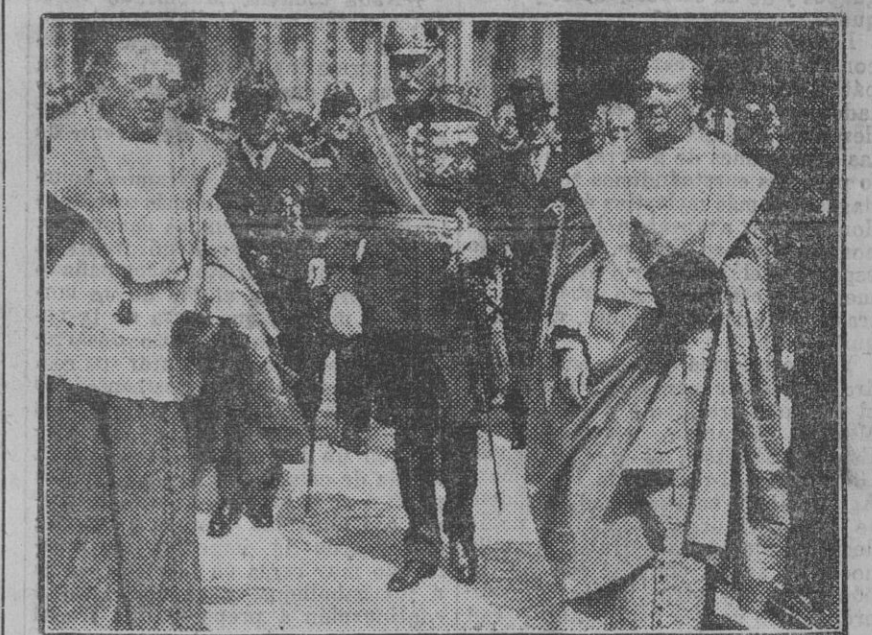
El infante don Carlos al salir de la Catedral, después de celebradas las honras fúnebres en sufragio de Primo de Rivera