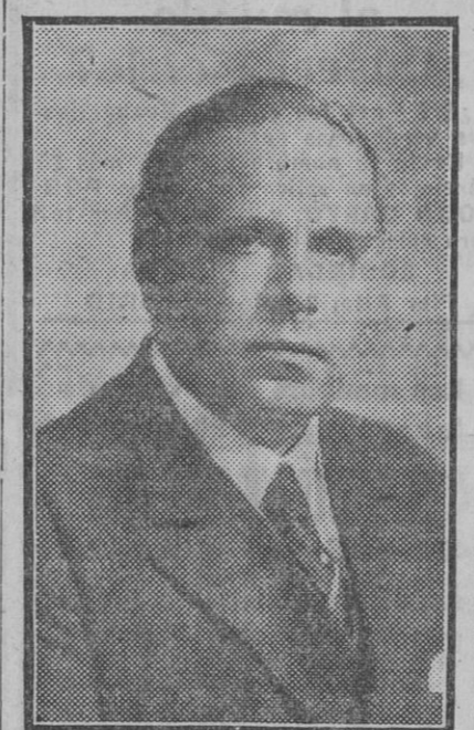
El ilustre escritor don Eugenio d'Ors, que esta tarde dará una interesante conferencia en la Universidad.

Tras de esta carroza, un nuevo grupo de tropa, con faroles rojos y amarillos y cuatro heraldos más, ataviados en la misma forma que los anteriores, avanza delante de la monumental carroza «España». Esta consistirá en emblemas representativos de la España actual, representados por figuras de alto relieve y diferentes frutas, símbolo de nuestra riqueza agrícola. En el centro de la misma, parte lateral, aparece el escudo de armas de España, sostenido y coronado por amorcillos en bronce imitado. Formando fondo de la España descrita y rematada por cresterías góticas, están esculpidos sobre piedra los escudos de Castilla y León. Finalmente, sobre macizo basamento, está representada con altos relieves dos hechos célebres del reinado de Isabel y Fernando: la rendición de Granada y el recibimiento de Cristóbal Colón. En la parte saliente del mismo basamento aparecen los escudos de armas de los Reyes Católicos, ejecutados en relieve é imitando bronce. Remata esta monumental carroza