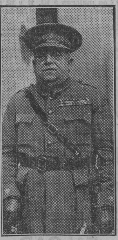
El bizarro coronel del Arma de Infantería, que actualmente manda el regimiento de Soria número 9, don Alfredo López Garrido, que acaba de ser ascendido á general de brigada

A saludarle acudieron á la estación el gobernador civil de la provincia, señor Mora Arenas; representación del alcalde, presidente de la Diputación, demás autoridades, representantes de las entidades culturales y otras muchas personas. El presidente de la Diputación, don Pedro Parias, marchó á Cádiz, acompañando al ministro de Instrucción.