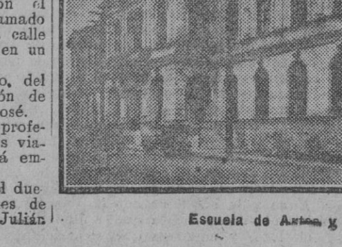
Escuela de Artes y Oficios de la Habana

La muchacha cayó a tierra bañada en sangre, y el agresor quedó detenido.