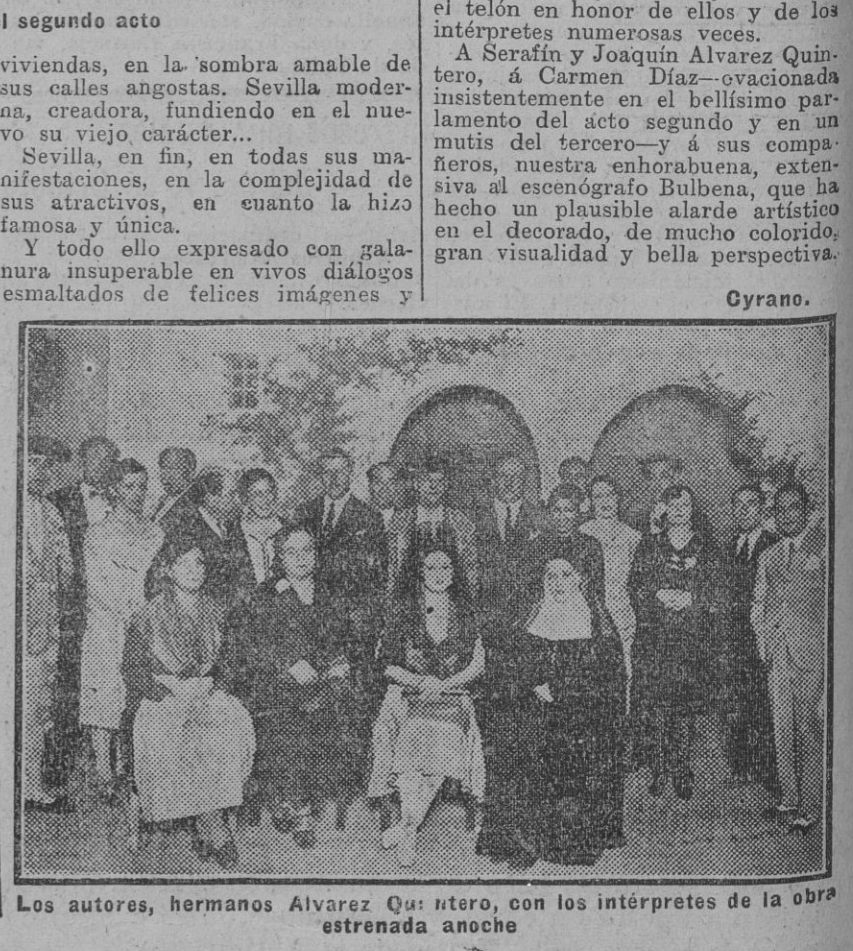
Los autores, hermanos Alvarez Quintero, con los intérpretes de la obra estrenada anoche

inextinguible a Dios, habría que ganar el cielo. Sevilla—el alma de Sevilla—es... Los hermanos Alvarez Quintero han logrado, en esta su comedia estrenada anoche con clamoroso éxito en el teatro de la Exposición, dar una versión interpretativa de la ciudad, que parece obra de magna ó milagro. Glosemos el título de la hermosa comedia, lleno de sugerencias de la ciudad, de su historia, de sus leyendas, de la gracia de sus costumbres populares, para afirmar que los duendes de Sevilla han sido en esta ocasión y para fortuna de la tierra, Serafín y Joaquín, que escondidos anoche mientras el alma de Sevilla hablaba por ellos, convirtiendo la ficción del teatro en una realidad tangible, hacían vibrar con temblores de emoción las almas humanas. ¡Bella descripción de lo que aparece a indescriptible! ¡Fervorosa exaltación de Sevilla en homenaje inestimable de cariño! Bien puede ufanarse la ciudad de estos sus hijos predilectos que así la veneran. ¡Análisis de la comedia? Quédense para otras plumas más obedientes a la reflexión ecuaníme que la nuestra en esta hora. Anoche venció el corazón, entregado ardorosamente a la ciudad con ritmo acelerado.