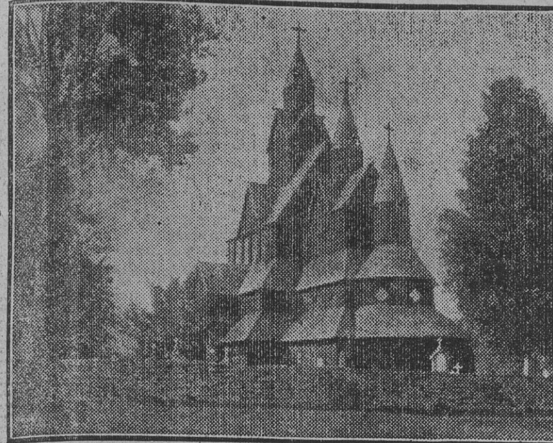
NORUEGA.—La típica iglesia de Hitterdal, del siglo XII.