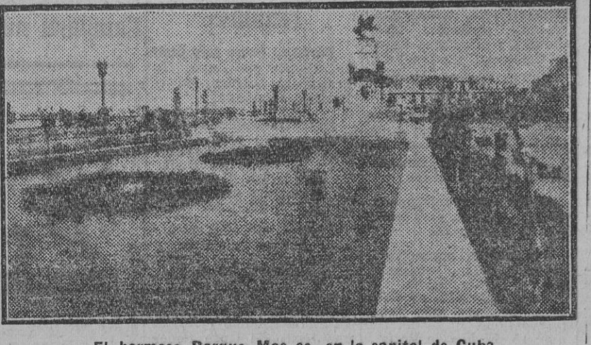
El hermoso Parque Mac eo, en la capital de Cuba

El retraso con que empezó la interesante velada musical nos priva de detallar la magistral labor realizada por el joven concertista, a quien el distinguido auditorio prodigó cálidias y repetidas ovaciones.