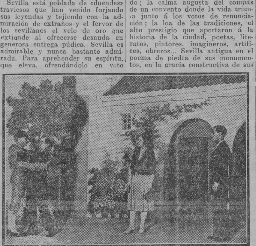
Una escena del segundo acto

BANQUETE DE DESPEDIDA AL ENBAJADOR DE LOS ESTADOS UNIDOS Madrid 11.—En las primeras horas de la tarde se celebró en la Secretaría de Asuntos Exteriores el almuerzo en honor del embajador de los Estados Unidos. Asistieron el Presidente del Consejo, el Nuncio, el ministro de Fomento, el secretario de Asuntos Exteriores y otras personalidades.