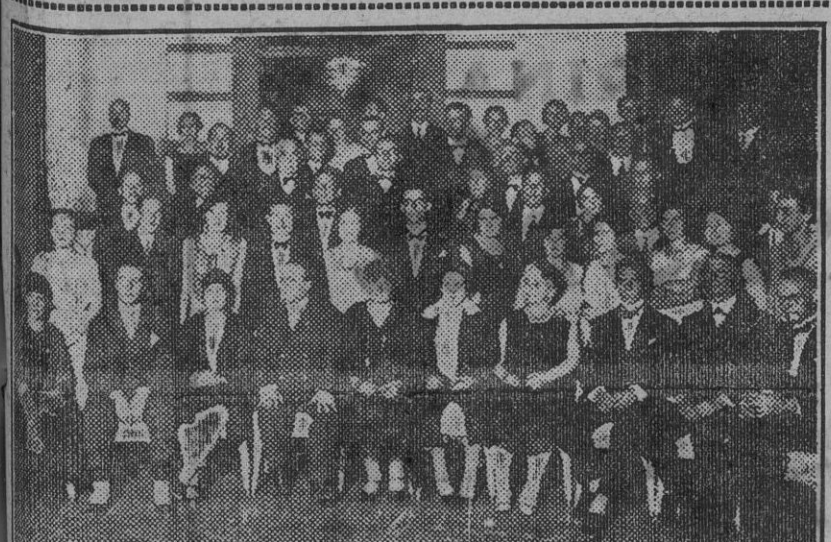
Acto en honor de los profesores y alumnos fascistas italianos, celebrado anoche en el Casino Municipal.

Carreño y Sevilla, los afortunados autores de «La del Soto del Parral» y padres de este nuevo y admirable sainete «Los clavetes», que el maestro Serrano ha prestigiado musicándolo, han logrado un libro que es ejemplar perfecto de esta modalidad escénica, al gusto madrileño, fino, original, gracioso, pulcro y limpio y apto para toda clase de públicos. Porque conocemos el libro y hemos asistido a los primeros ensayos podemos hacer estas afirmaciones. Pocas veces en efecto, se consigue, como está logrado en «Los clavetes», un sainete que, siguiendo las normas clásicas, está hecho con toda honradez literaria y que sólo pone en juego, con experta habilidad técnica, todos los recursos escénicos que el buen gusto autoriza para lograr un éxito sano, no despertando en el público otros sentimientos que los de legítima complacencia por la feliz solución—honesta toda—que los autores dan al pequeño problema que la farsa plantea.