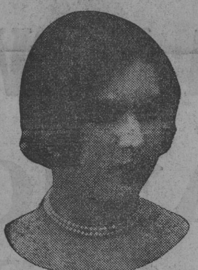
DE NUESTRO CONCURSO DE BELLEZA Número 73.—SEVILLA. Lema: FLOR DE MISTERIO.