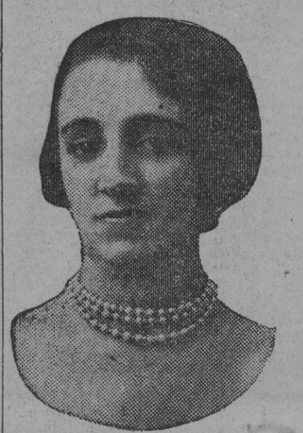
DE NUESTRO CONCURSO DE BELLEZA Número 85.—ALMERIA. Lema: ESPERANZA.

Cádiz 9.—Ha zarpado el trasatlántico «Reina Victoria Eugenia». Antes de partir se inauguró la exposición flotante de pintura, debida á la iniciativa del conde de Güell. Varios artistas han trabajado en la instalación de dicha exposición, que ha resultado espléndida, figurando en ella numerosos cuadros.