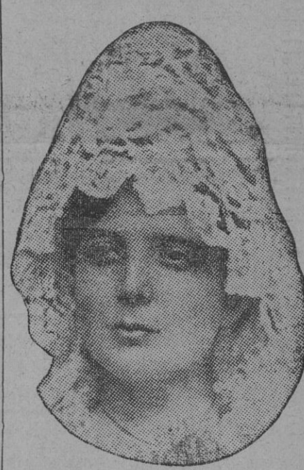
DE NUESTRO CONCURSO DE BELLEZA Número 80.—SANLUCAR BDA. Lema: ESTRELLA.

Las tres ciudades de Aragón concurrirán conjuntamente al Certamen.