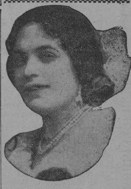
DE NUESTRO CONCURSO DE BELLEZA Número 89.—SEVILLA. Lema: CANTAORA DE SAETAS.