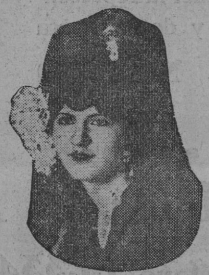
DE NUESTRO CONCURSO DE BELLEZA Número 86.—HUELVA. Lema: LA FLOR DEL PERI.