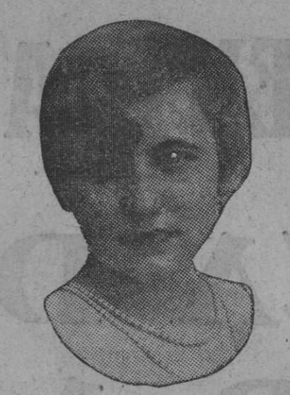
DE NUESTRO CONCURSO DE BELLEZA Número 75.—JEREZ FRONTERA. Lema: CHARLESTON.