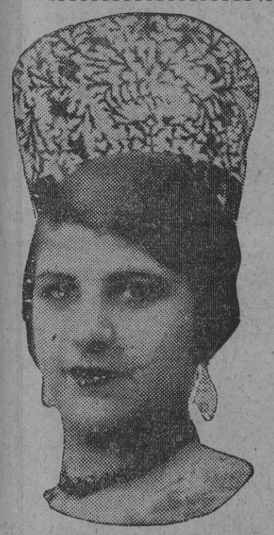
DE NUESTRO CONCURSO DE BELLEZA Número 84.—SEVILLA. Lema: ¡SEVILLANITA SOY!

A este acto concurrieron todas las señoras que componen la Delegación del Gobierno de la República, las distinguidas esposas de