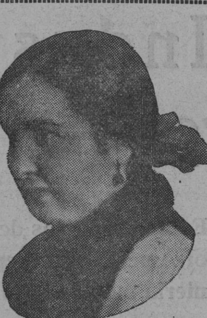
DE NUESTRO CONCURSO DE BELLEZA Número 83.—HUELVA. Lema: VIENA.