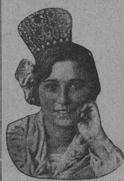
DE NUESTRO CONCURSO DE BELLEZA Número 88.—SEVILLA. Lema: GITANILLA DE TRIANA.