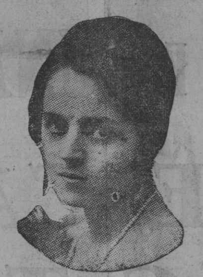
DE NUESTRO CONCURSO DE BELLEZA Número 74.—BADAJOZ. Lema: EXTREMEÑA VERDAD.