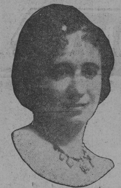
DE NUESTRO CONCURSO DE BELLEZA Número 77.—SEVILLA. Lema: ENSONACION.