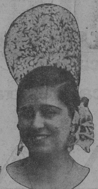
DE NUESTRO CONCURSO DE BELLEZA Número 78.—SEVILLA. Lema: VIVA EL CACHORRO.

Lorsqu'elle était mon amoureux, qu'elle montait le soir, heureuse, comme aussitôt, malgré décembre, on avait chaud dans notre chambre. Et maintenant, seul, sans personne, quoi d'étonnant que j'y frissonne, qu'en plein juillet on y grelotte, qu'on deux riaient un seul sanglot?... Je n'attends rien, fermez ma porte: fermez-la bien, car elle est morte. L. Moreau de Montenac.