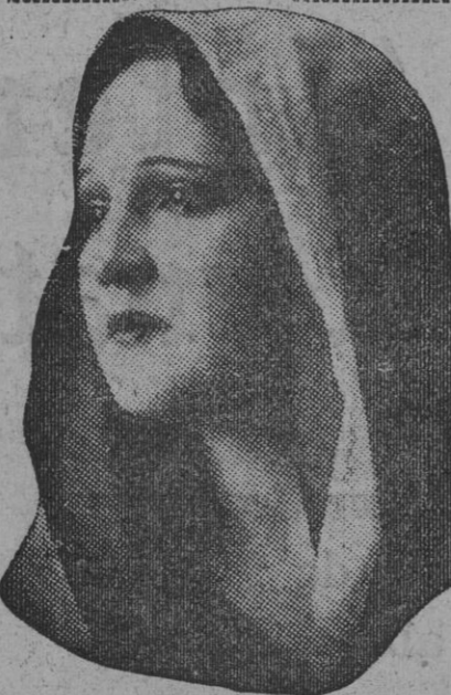
DE NUESTRO CONCURSO DE BELLEZA Número 81.—GRANADA. Lema: ARABE.