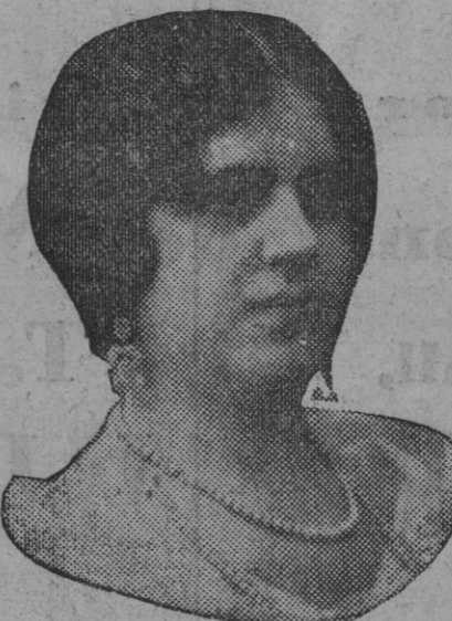
DE NUESTRO CONCURSO DE BELLEZA Número 87.—SEVILLA. Lema: ESPERANZA.