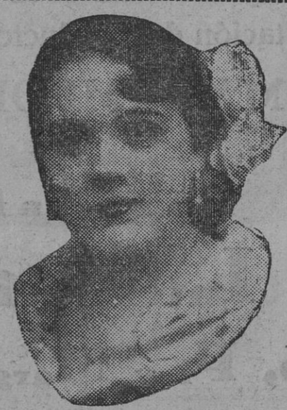
DE NUESTRO CONCURSO DE BELLEZA Número 90.—SEVILLA. Lema: FLOR MACARENA.