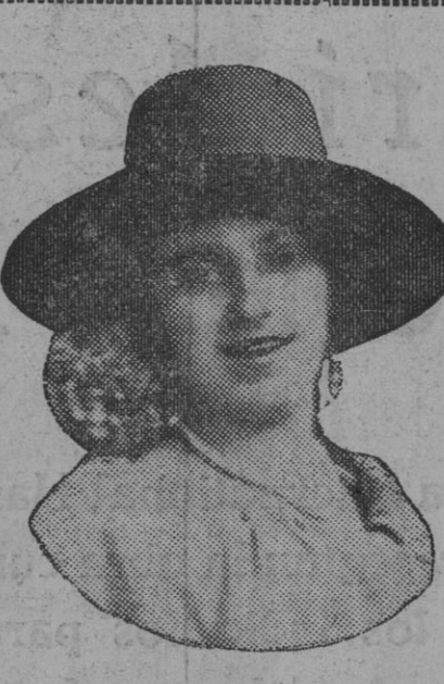
DE NUESTRO CONCURSO DE BELLEZA Número 82.—BADAJOZ. Lema: FLOR DE HUNGRIA.