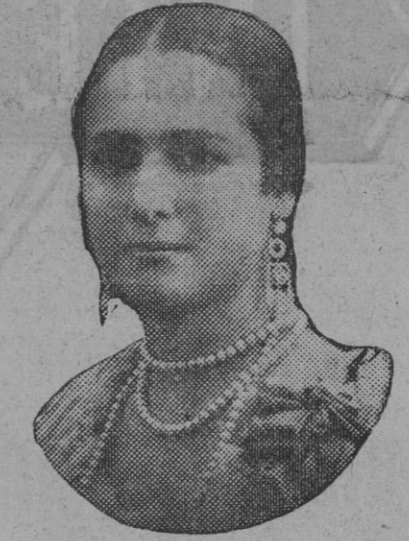
DE NUESTRO CONCURSO DE BELLEZA Número 79.—TRIANA. Lema: PERLA BRASILEÑA.

Enamorado de la hermosa Clío, que inspira de la Historia los años, los herrumbrosos tiempos medioevales, los sabe exhumar de un dédalo sombrío. Y la gloriosa historia de este río, de esta ciudad los héroes inmortalizados surge á la voz de su albedrío! Pudo el tiempo y la suerte transitoria sepultarle entre escombros polvorientos, pero jamás extinguirán su gloria; pues su labor tenaz que es un portento, siendo monumental para la Historia, es de Sevilla eterno monumento! Tirso Gamacho.