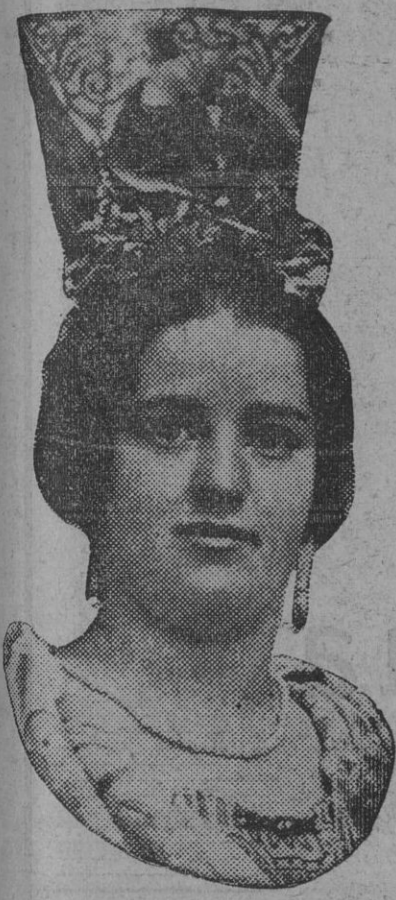
DE NUESTRO CONCURSO DE BELLEZA Número 76.—SANLUCAR BDA. Lema: GAUDALQUIVIR.