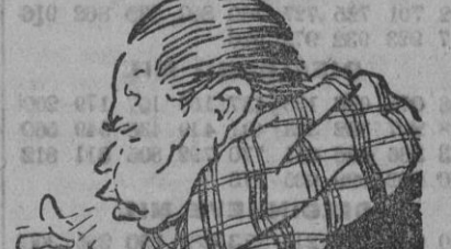
Por qué conservar ese maldito rasfido, que le causa a usted, cuando con la SOLUCION PAUTAUBERGE puede usted verse libre de él al cabo de unos días? L. PAUTAUBERGE (París) y en todas las farmacias.

Con estos acuerdos, aparte de hacer honor al sentimiento de gratitud que late en el pecho de todos los palenses, daremos satisfacción en lo posible al sentir unánime de los vecinos de La Palma, que desean la continuación indefinida de tan popular y querido