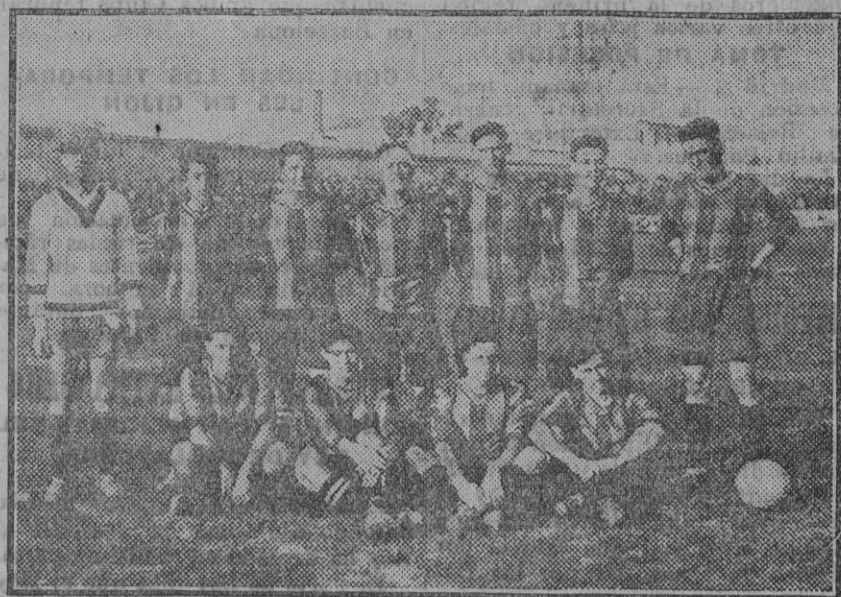
Equipo de la Gimnástica de Triana, que el día primero de año inauguró su campo de juego

de Quintero, de Pizarro, de Pedro Arias, de Diego Colón, de Marcos de Obregón, de Sebastián Gaboto, de Pánfilo de Narváez, de Hernando de Soto, de Gonzalo de Salazar, de Alonso de Camargo y de otros muchos que dieron al puerto de Sanlúcar la gloria de haber visto izar majestuosas las velas que los llevó a conquistas inmortales.