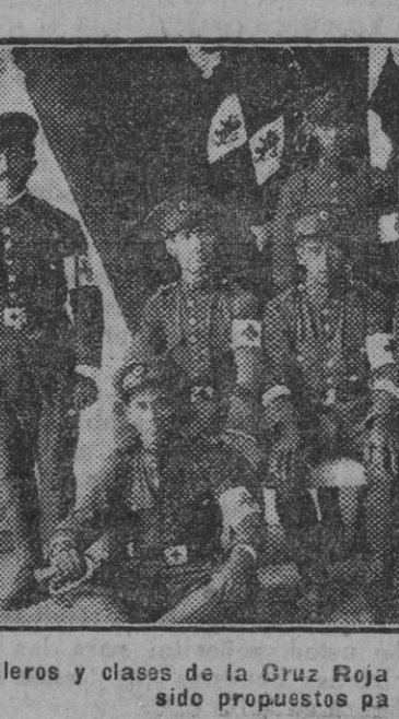
Camilleros y clases de la Cruz Roja cordobesa que por sus servicios han sido propuestos para una recompensa.

humorismo aparte, yo, en la heterogénea mesa electoral del mundo, dejé mi modesto y sincero voto por la mujer española, madre de corazón abierto y profundo. A todos los «schibismo» y «genialidades» (llamémoslos así, con tolerancia...) de la mujer extranjera, yo preferí, con todos sus mal llamados «prejuicios» y «chatearías», a esta, indígena... «mestras». A nuestras madres, nuestras hermanas, nuestras mujeres... También nuestras novias... Esas sublimes hembras, todas, que se saben adornar con el perfume de una flor, sonrír ante la vida, y que llevan los niños en brazos como los más bonitos y codiciados de los tesoros vivos, presentándose así a la admiración envidiosa y callada del mundo. Por eso, porque, como dije al principio, a España, más que a ningún pueblo de la tierra cabe aquella hermosa sentencia del rate hindú de las barbas de patriarca, glossada sutilmente en «Canción de cuna» y sublimada como una gesta gloriosa y santa en «Fruito bendito», de Marquina: «En el seno de toda mujer palpita un niño dormido.» Madres antes que nada. En España, donde, a diferencia de Norteamérica, nadie quiere morir en las clínicas lujosas, sino en el hogar sencillo. Maese Pedro.