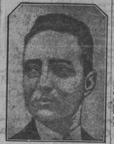
El comandante Byrd, jefe de la expedición que marcha al Polo Sur.