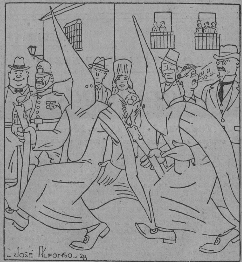
—Tenemos que ir más despacio. Estamos llevando la procesión a gran tren. —Déjalo; ¡ya parará el «tren» cuando hagamos «estación».

La mujer es... La mujer es abeja. El amor es su aguijón. Como ella punza y se aleja; pero ahonda más y no cesa jamás, si no nos lo deja clavado en el corazón. La mujer es idilio ó es martirio. Es un cuento idilio si se entrega. Y es incremento martirio si se nega. Emblema de los amores son las flores. Que un perfume es el amor de las almas emblemas. ¡Primer beso! Siempre fuiste en una flor. Ramón Martínez Cebrán.