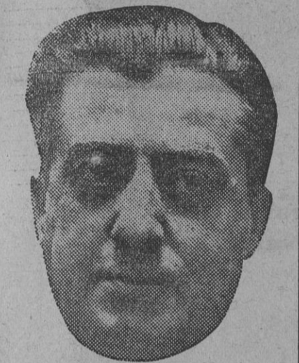
El ilustre tenor don José Baquero.

carías Arcos, notable contrato beneficiado de la Catedral, en el difícil versículo «Amplius», y con igual efecto sonaron las bellas voces infantiles de los «seises» en el «Redde».