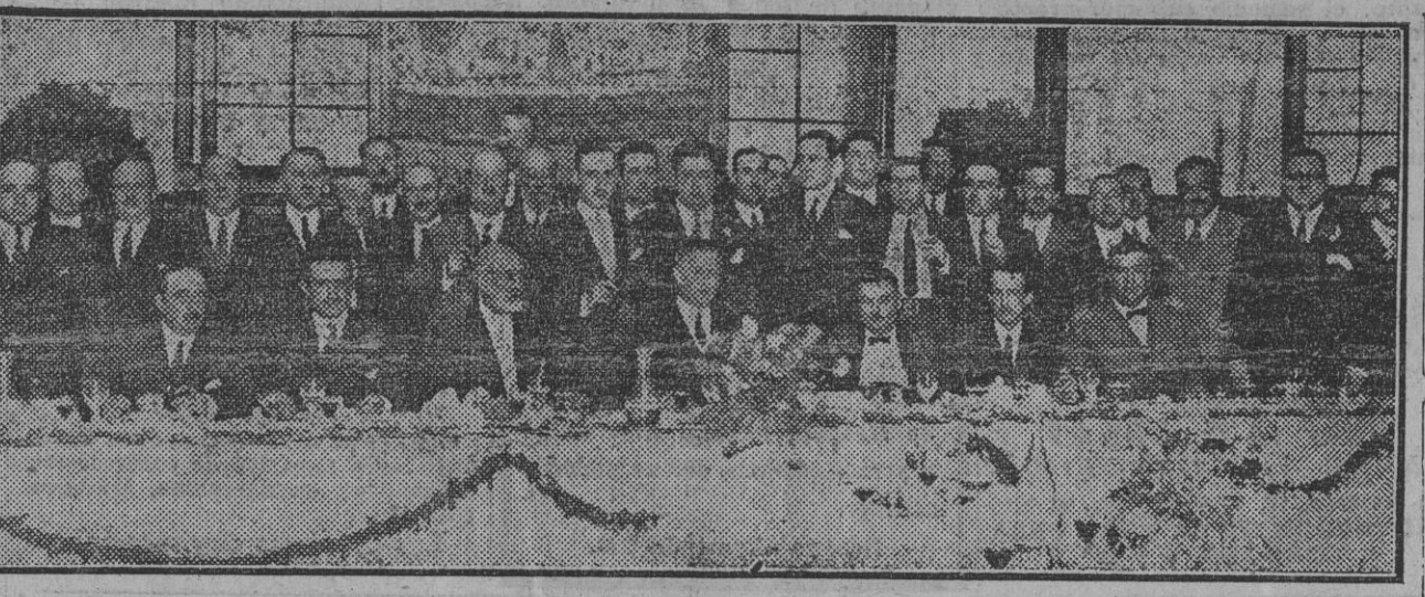
Presidencia del banquete al señor conde de Bustillo, con motivo de haberle sido concedida por el Gobierno la Gran Cruz del Mérito Naval

Madrid 28.—Esta noche se estrenó en el teatro del Centro la zarzuela de los maestros Serrano y Balaguer, titulada «La prisionera». La obra ha gustado mucho, tanto el libro como la música, siendo repeticos los números de la inspirada partitura.