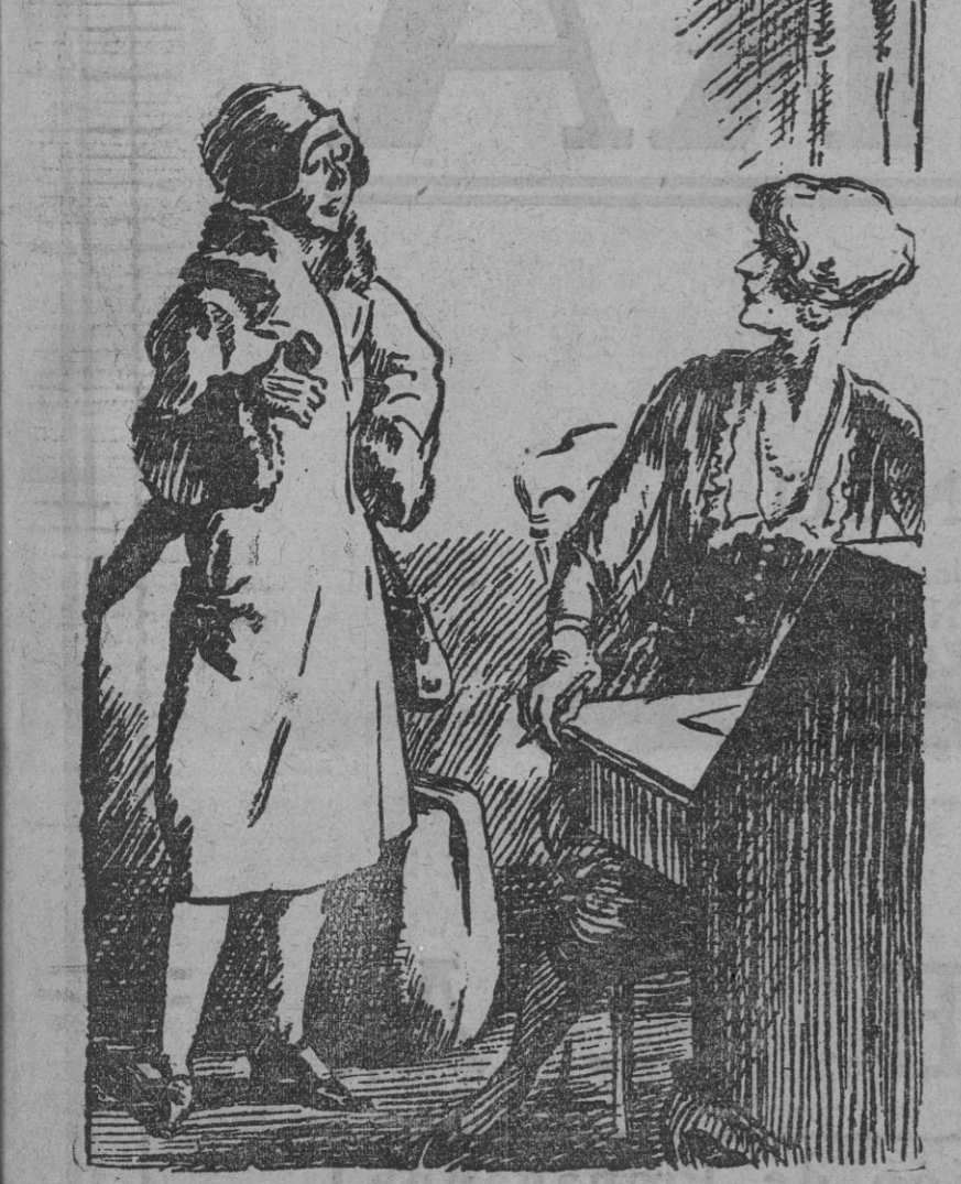
La duena a la criada que se despide.—Bueno, María, ¿usted no quería que yo en la recomendación diga la verdad, toda la verdad? La criada.—Usted verá lo que hace, porque yo también sé decir... Este número ha sido visado por la censura

Tenía el grado de teniente y había ingresado en la Escuela de Aviación rusa.