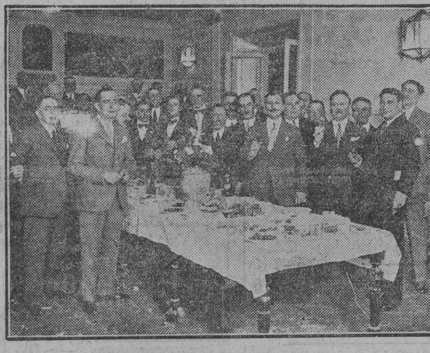
Algunos elementos del Ateneo reunidos con los hermanos Alvarez Quintero durante el vino de honor con que fueron obsequiados ayer tarde, en agasajo íntimo, los ilustres autores.

De la noche, en las páginas 1, 2 y 3. De la mañana, en las páginas 4, 5 y 6.