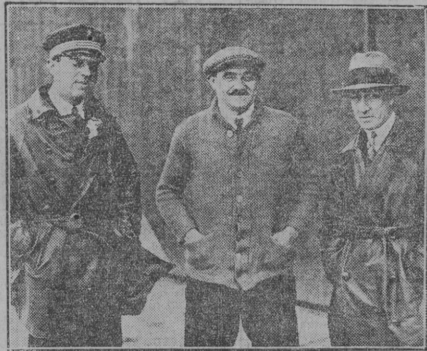
El piloto francés M. San Román, con su mecánico y observador, momentos antes de comenzar el 'raid' en el cual se teme hayan sucumbido.