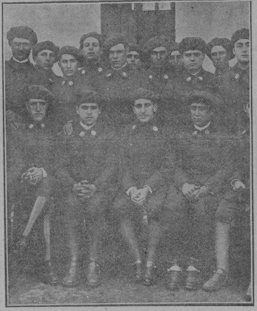
El nuevo uniforme con el cual se han incorporado hoy los reclutas del actual replazo.

Horas de oficina en la Administración de EL LIBERAL de nuevo mañana a siete tarde.