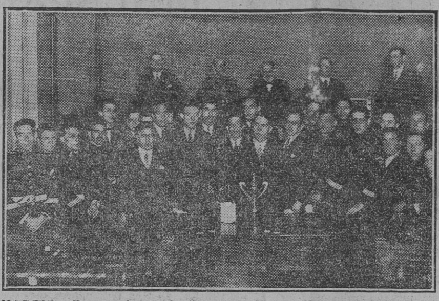
MADRID.—Reparto de premios a los ganadores del primer Concurso Nacional de Radiotelegrafía. Foto. Agencia Gráfica. Fdo. Corl.