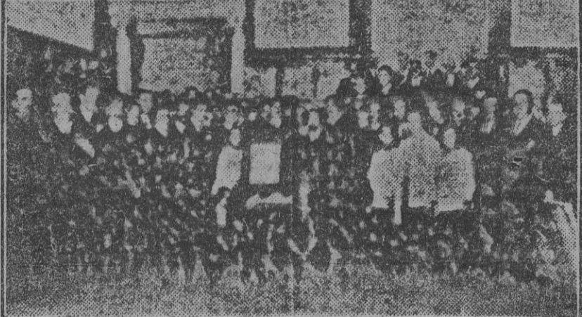
HUELVA.—Acto cordial de la entrega de un artístico pergamino por los empleados y obreros de la Junta de Obras del Puerto á su ingeniero...