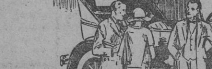
Mejor Que Nunca

Accedías, 1,75 pesetas kilo; alme- jas, 0,75; besugos, 0,90; per, espada, 1,75; corvina, 3,00; cazón, 1,50; cho- eos, 1,75; gambas, 1,75; morralla, 1,40; merluza, 3,00; pescadillas, 1,85; rubios, 0,80; salmónetes, 2,75; sardinas, 2,00.