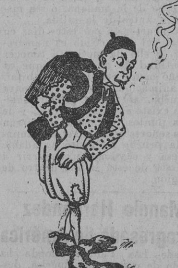
—¿Te limpio las botas?..