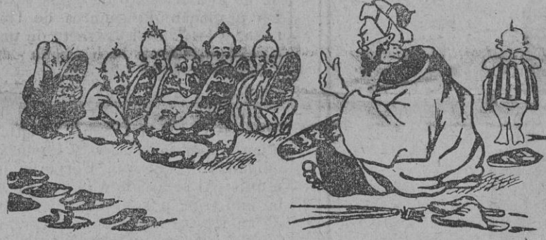
El pedagogo herberbe, ¡siempre sentado!, convence á los chicos de que las babuchas duran mucho más quitadas que puestas.