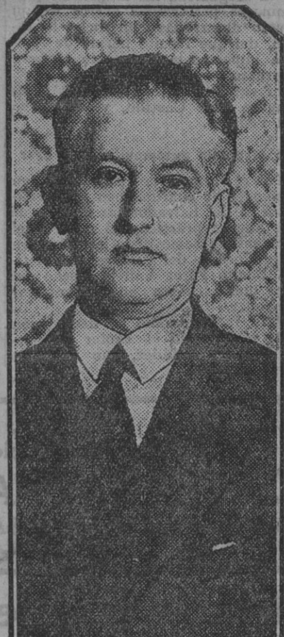
El conde de Bustillo, nuevo alcalde de Sevilla, de cuyos méritos se espera una acertada gestión municipal.