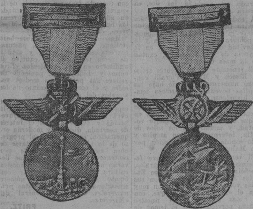
Anverso y reverso de la Medalla de Oro que para conmemorar el vuelo trasatlántico imprimió el Rey a los aviadores tripulantes del «Plus Ultra», a su regreso, en Palos de Moguer.

Dicha medalla ha sido confeccionada por artifices cordobeses. Fdo. Gori