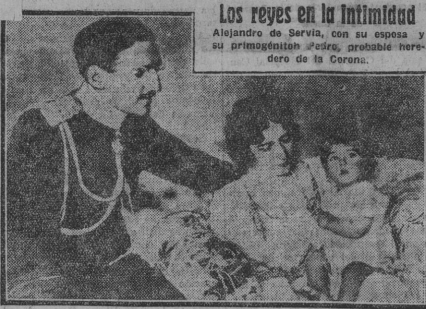
Los reyes en la intimidad Alejandro de Serbia, con su esposa y su primogénito Pedro, probable heredero de la Corona.

Cuestión primordial es ésta, que esperamos habrá de prevalecer sobre todas las otras, para que una vez solucionada, puedan libre y fácilmente orientarse las energías en la dirección firme y segura que reclama el interés de nuestra población.