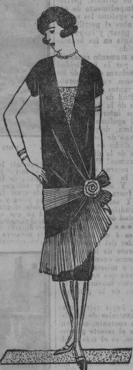
Núm. 2. Bellos Trois Pieces para señoras jóvenes.

Se hacen estas «toilettes», tan propias para paseo, de Reps, Kashá Crepaiga ó Tusaiga, sencillamente adornadas con cuellos y puños de piel y pequeños detalles de la misma tela del traje y también pequeños botones. Pueden muy bien sustituir para paseos del mediodía los grandes abrigos y dejan más libertad para hacer los paseos que ahora hacemos todas para conservar una elegancia en nuestra figura.