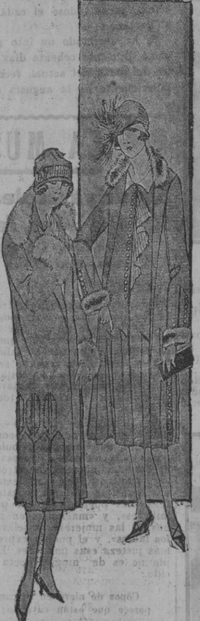
Núm. 1. Sugestivo traje para jovencitas.

Se confecciona este elegante traje de pana negra y se adorna con plisados de crepp color topo. El volante va recogido en el lado izquierdo, así como el cinturón, que es del mismo género que el volante, con una rosa de terciopelo color gris verdoso. Pequeño peto de crepp, bordado de seda del color de la rosa del cinturón. El volante está colocado alrededor de toda la falda.