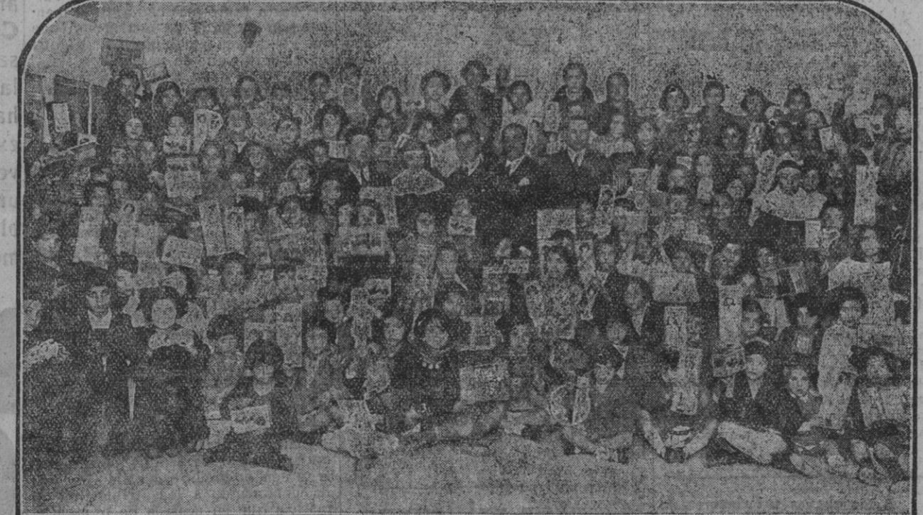
Los comisionados del Ateneo con los alumnos del Colegio de la Doctrina Cristiana (calle de los Angeles), entre quienes repartieron gran número de juguetes.