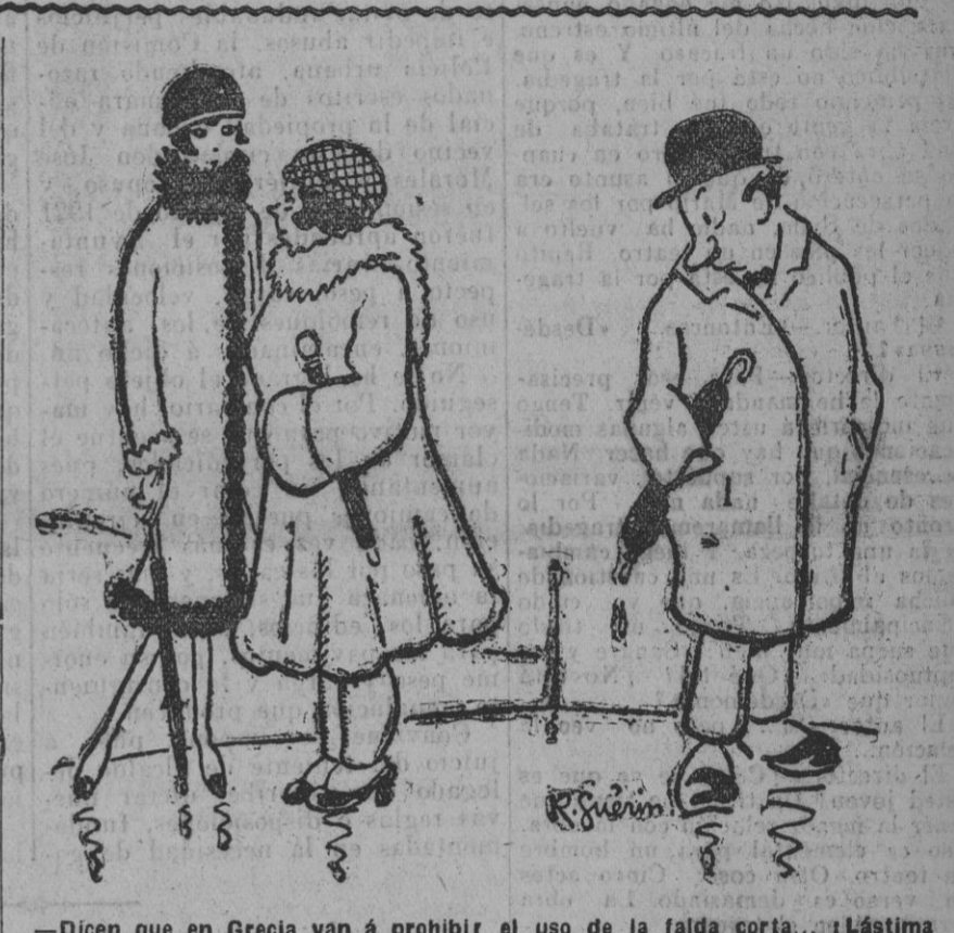
Dicen que en Grecia van a prohibir el uso de la falda corta... ¡Lástima que estas dos no vivieran allí!

Queremos también en esta sección huir de las coplas fúnebres; de esas coplas de verdugos, audiencias, santolios y cementerios, y de las del trabajo en las minas, las jacas de contrabando y las liebres con sus orias. Tienen más interés, más emo-