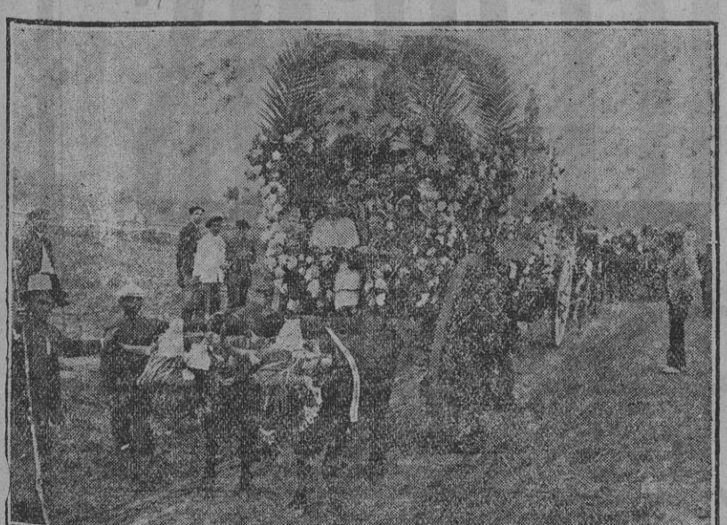
De la romería de Valme.—Artística carroza, ocupada por bellas jóvenes, que concurrió a la romería. Fdo. Gori.

El mencionado barco fué sorprendido por una violenta tempestad a la altura del cabo de Finisterre y arrastrado de nuevo hacia alta mar, llegando hasta Queberon, donde se salvó milagrosamente de ser estrellado en las rompientes.