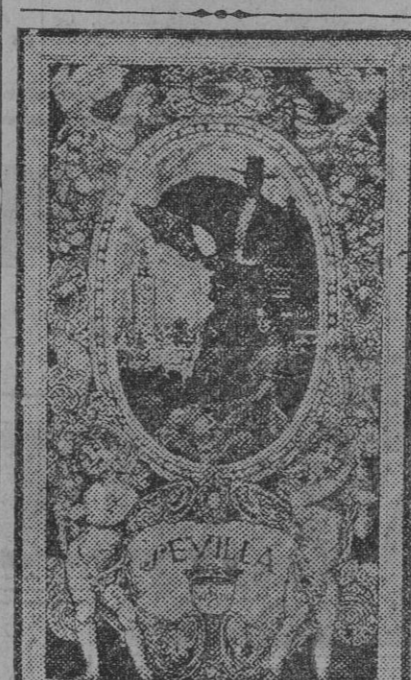
«Macarena», primer premio de portadas para el folleto de propaganda de nuestras fiestas de Primavera, original de Teodoro N. Miciano.

VEA V. NUESTRA SECCION DE ANUNCIOS POR PALABRAS