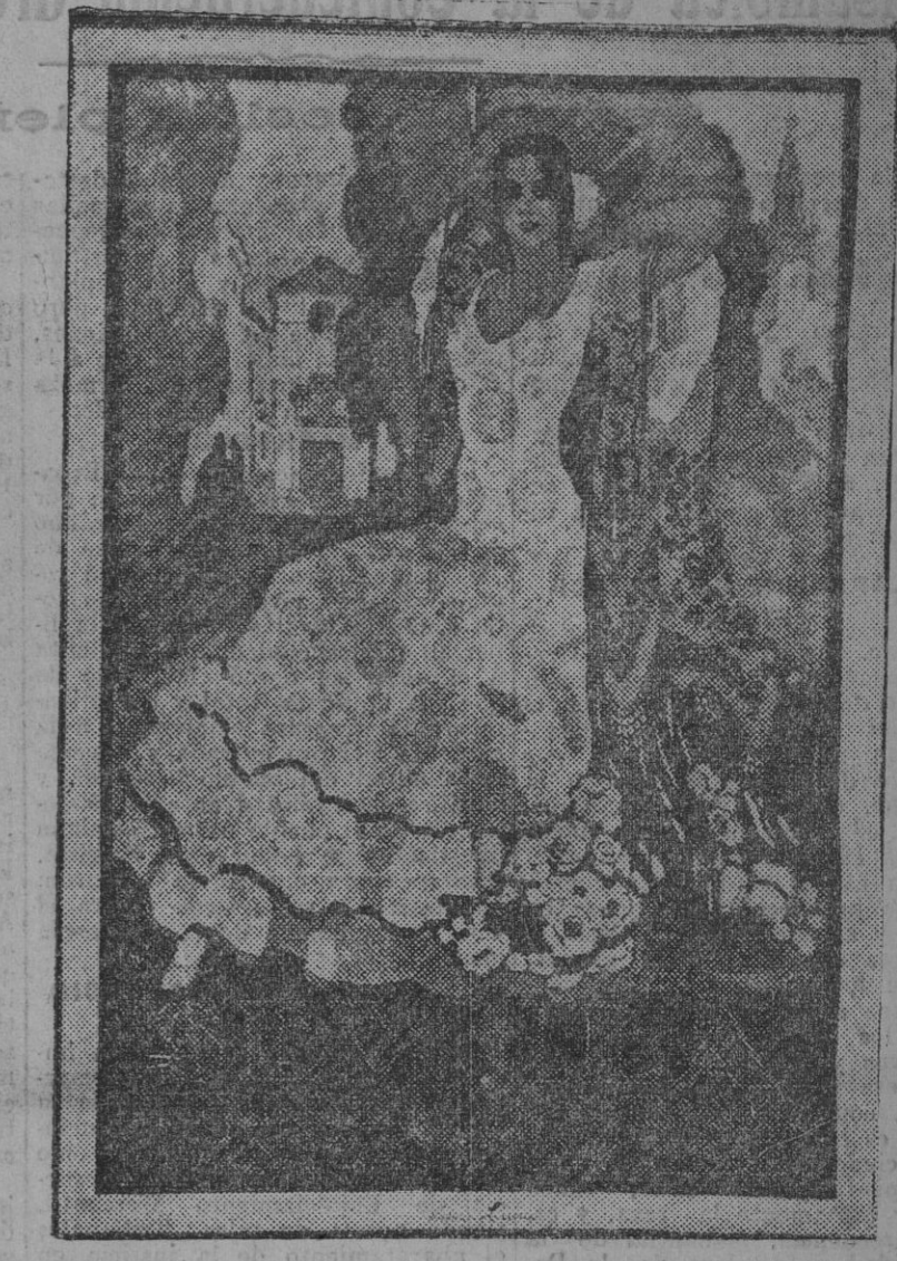
«Claro de luna», cartel anunciador de nuestras fiestas primaverales, original de autor local propuesto por el Jurado para una recompensa, por no existir otro premio.

Conceder el más amplio voto de gracia a la Directiva por los trabajos que viene realizando para la celebración del Certamen que ha de celebrar el presente año, el cual ha despertado mucho interés en toda España, y para el cual se han recibido ya bastantes trabajos, a pesar que el plazo de admisión de los mismos no expira hasta el día 20 de Octubre próximo. Por unanimidad fué designado para pronunciar el discurso de apertura en dicho Certamen un distinguido maestro nacional de esta ciudad, y se acordó invitar para que tome parte en el expreso acto a un elocuente académico de la de Buenas Letras de esta ciudad, muy felicitado y aplaudido por sus trabajos científicos. También se nombró una Comisión, compuesta por los señores Burguillos y Menéndez, para que