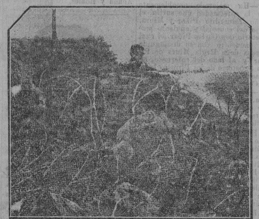
Un puesto español de enlace en la zona occidental, desde el que se domina la entrada de Rio Martin.