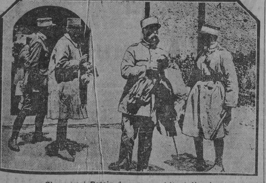
El mariscal Petain durante su visita á Uazzán.