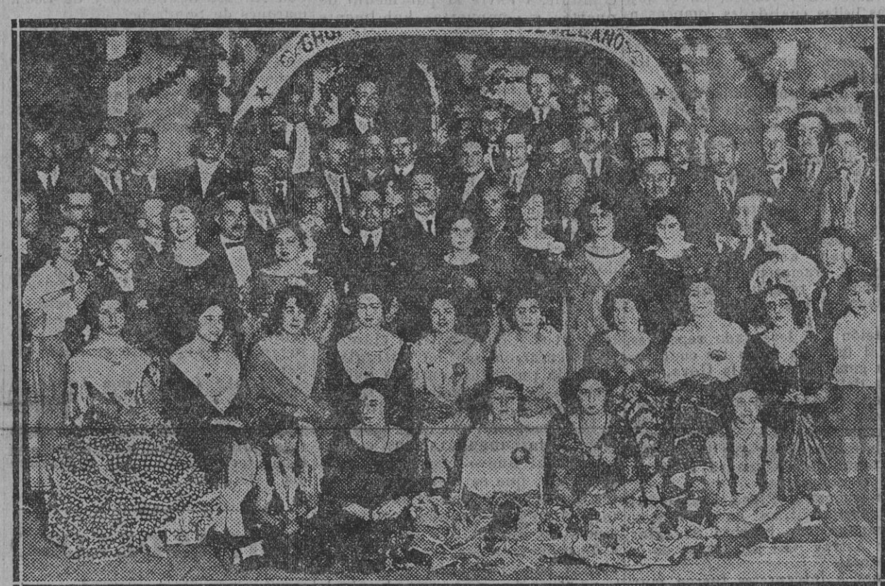
Concurrentes a la fiesta celebrada anoche ante la Cruz instalada en el Salón Benavente.