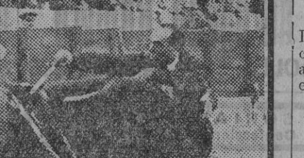
El diestro Algabeño muleteando a su primero.