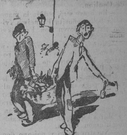
¡La sangre del pobre!