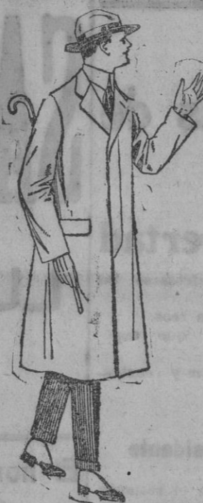
Gabanes de cheviot, melton, etc., con forro de seda o satén, depts. 60 a 160