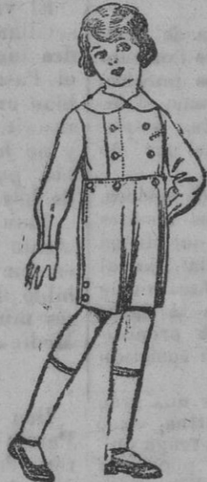
Trajes de vicuña o estambre azul, para niños de 3 a 7 años, de pesetas 25 a 30. Los mismos de dril liso, de pesetas 10 a 15.