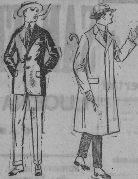
Trajes de alpaca negra o azul, de pesetas 80 a 115. Americanas de alpaca negra o azul, de ptas. 40 a 70

en dormitorios y los muebles más botitos y baratos los vende al contado y a plazos Eduardo Santander, Corredera, 32. Grandes rebajas de precios.