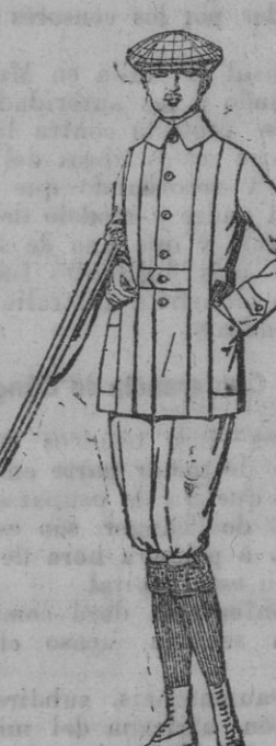
Cazadores de dril crudo o kaki de pesetas 25 a 35. Pantalones cortos, para excursionistas, de dril, beige o gris, de ptas. 10 a 18.