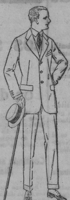
Trajes de lanilla, melton, estambre, vicuña o jerga, de pesetas 20 a 135. Trajes de dril listado, kaki listado de pesetas 28 a 60.