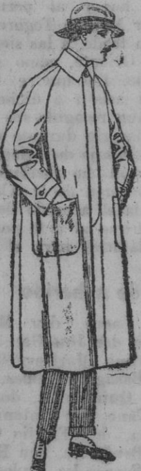
Impermeables de forma gabán, raglán de pesetas 40 a 170. El mismo modelo en caoutchouc, negro, de pesetas 70 a 90.