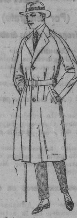
Gabanes de cheviot, cower, melton, gabardina, etc., de pesetas 80 a 185. Grandes existencias en géneros para gabanes a medida.