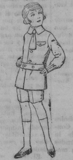
Trajes de lanilla, melton etc., para niños de 4 a 9 años, de pesetas 15 a 25. Los mismos de dril liso o listado, de pesetas 11 a 18

ESPECIALIDAD EN LA MEDIDA Boas, camisería, géneros de punto, corbatería, guantería, sombrería, zapatería, paraguas, bastones, sombrillas y artículos de viaje.