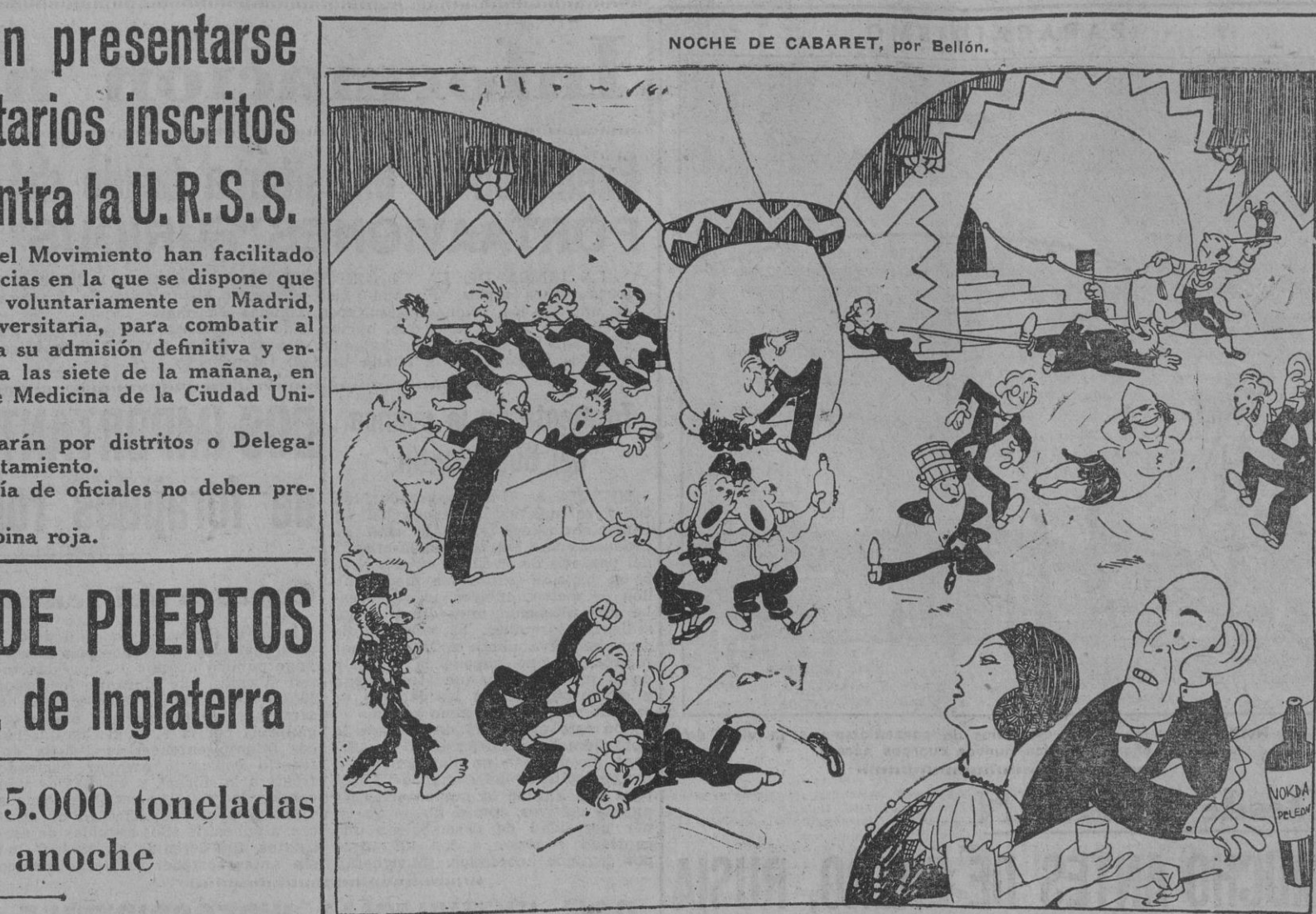
ELLA.—Ya veo que tienen la manía de imitar a los rusos; pero este del suelo, ¿quiere decirme, mister, a quién imita? EL.—A un ruso que está en el frente.

BERLIN, 3.—Del comunicado del Alto Mando alemán: "La lucha contra la navegación inglesa de abastecimientos ha obtenido también durante el mes de junio el gran éxito que se esperaba. La Marina de guerra y la aviación hundieron 768.950 toneladas de mercaderías enemigas. De esta cifra, los submarinos echaron a pique 417.450 toneladas. Hay que agregar las pérdidas importantes sufridas por el enemigo a consecuencia de las minas. Además gran número de mercaderías inglesas resultaron tan gravemente averiadas que durante mucho tiempo no podrán ser utilizadas para el abastecimiento del enemigo. La D. C. A. alemana ha logrado igualmente grandes victorias en su lucha contra la aviación británica. Desde el 26 de junio al 2 de julio 109 aviones fueron derribados, 56