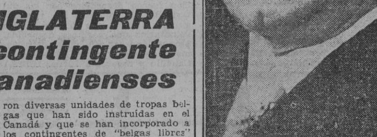
Coronel Knox, ministro de Marina norteamericano, cuyo reciente discurso se interpretó como una clara petición de guerra.

El Duce ha recibido al presidente del Consejo de Albania, Veliaqi, con el que celebró una larga y cordial conversación. Asistió a esta entrevista el ministro de Relaciones Exteriores, conde Ciano. (Efe).