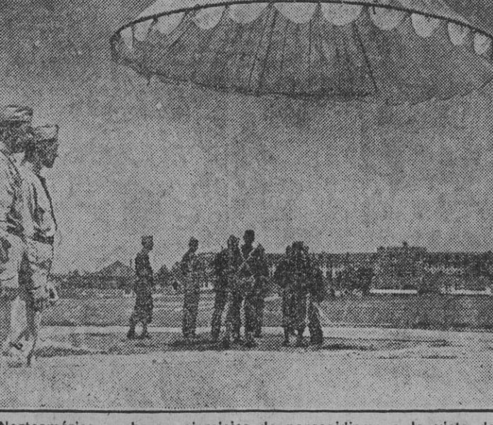
En Norteamérica se hacen ejercicios de paracaidismo a la vista de la eficacia de los nuevos cuerpos aéreos.