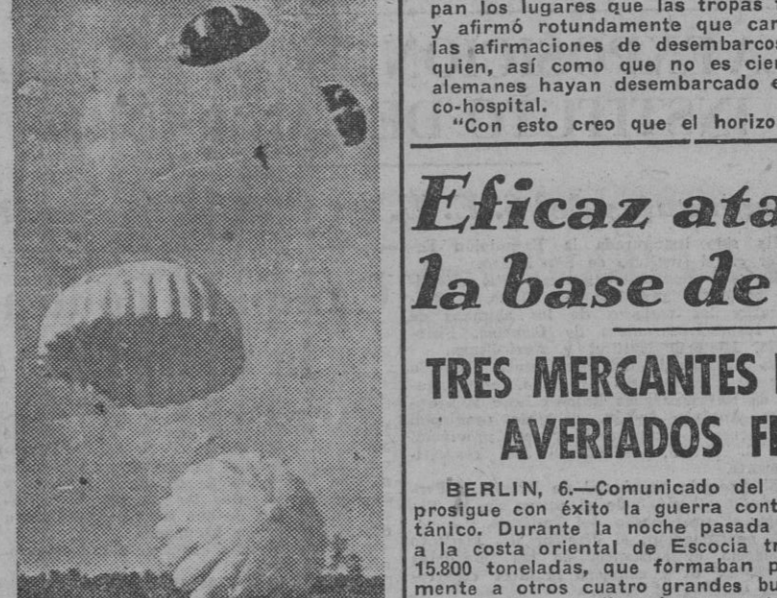
Los paracaidistas, desplegados en el cielo, se asemejan a las medusas por la belleza de sus líneas y su ingrávididad. Si no fuera por la dura prueba a que se ha de someter el hombre que se mantiene bajo sus hilos tensos, cabría decir que es el Arma más bella y más insustituible de la guerra.