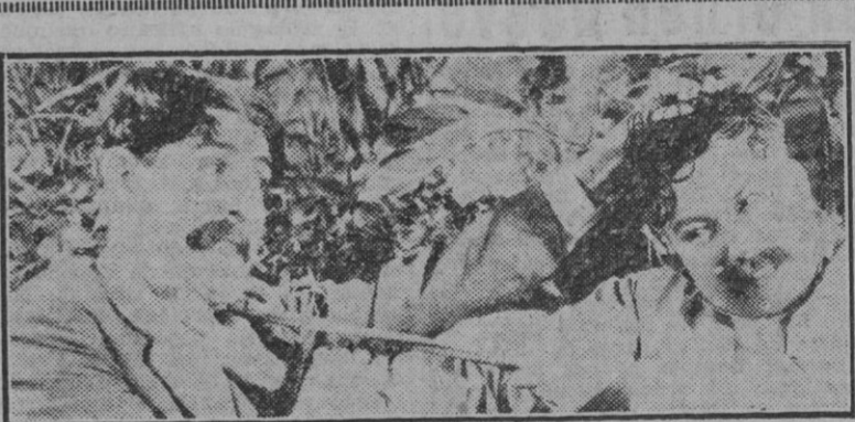
Una escena de la divertida comedia cinematográfica, de costumbres mejicanas, titulada "La tía de las muchachas", superproducida por Rey Soría Films, que será estrenada el próximo lunes en el cine Imperial.