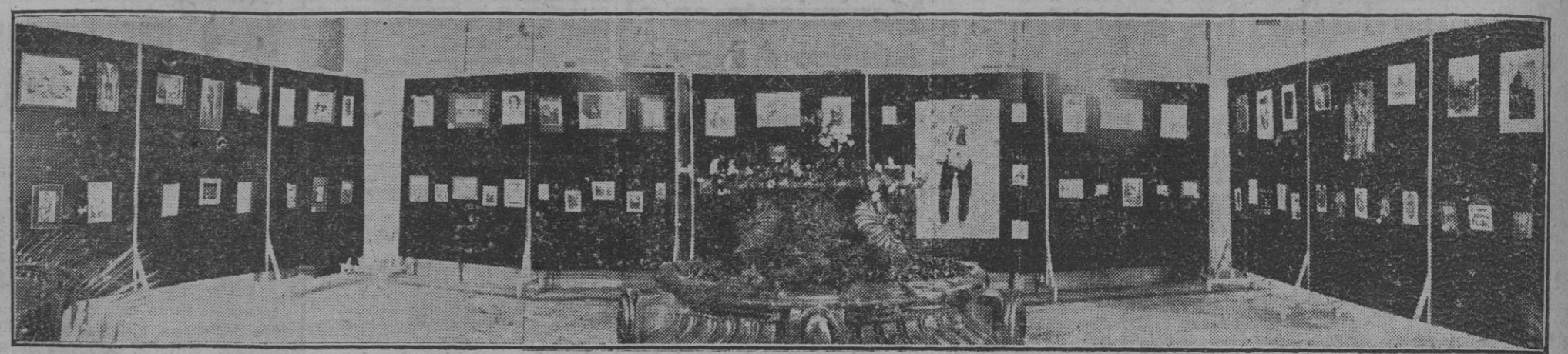
Aspecto de uno de los laterales de la sala del palacio de Bellas Artes, donde está instalada la gran Exposición de Arte de la Obra Sindical de Educación y Descanso. A dicha Exposición han concurrido numerosos artistas, cuyas obras rivalizan en noble esfuerzo de belleza y armonía. Retratos, paisajes, composiciones, modernos conjuntos decorativos y múltiples variedades de arte pictórico, donde el aficionado y el técnico pueden apreciar el notable valor de los artistas que han concurrido amorosamente y con inimitable entusiasmo a tan magnífico Certamen.

Próxima respuesta Holandesas al Japon Continúa la vista del proceso contra los legionarios de Rumania Se cita a Antonescu como testigo Desde ROMA Enormes pérdidas navales británicas