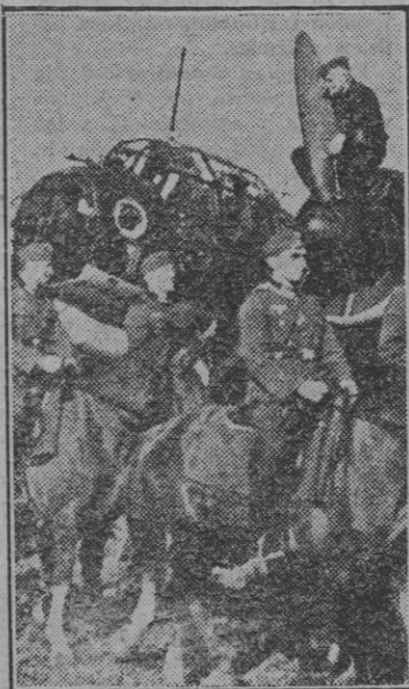
Pese a que la mecanización ha influido generalmente en la táctica de las modernas guerras, el noble pero no ha perdido su importancia y es eficazmente empleado donde requieren las circunstancias. En la foto, un destacamento de Caballería ante un magnífico avión del Reich.