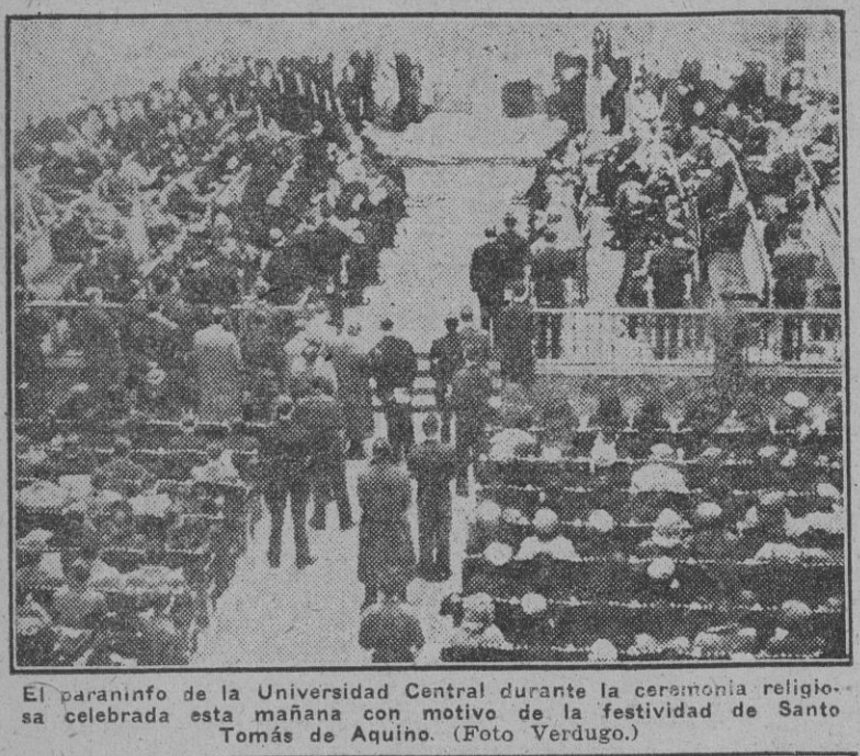
El paranteón de la Universidad Central durante la solemnidad religiosa celebrada esta mañana con motivo de la festividad de Santo Tomás de Aquino.