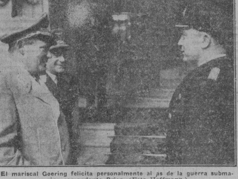
El mariscal Goering felicita personalmente al jefe de la guerra submarina comandante Prien.