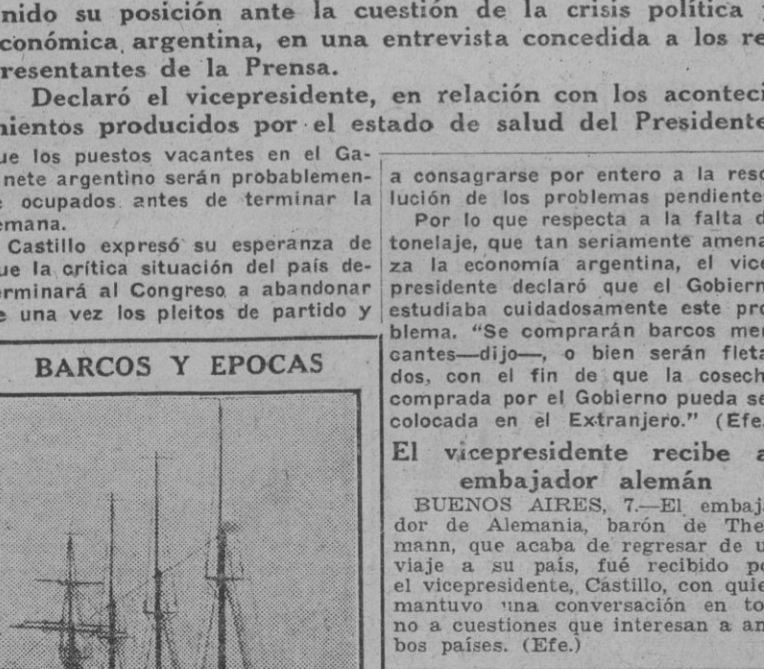
Más bien parece esta motonave un barco ochocentista sobre el que lo único que puede hacerse es admirar la luna riolando en el mar. Sin embargo, los tiempos mandan y las naciones recurren al uso de todo lo que tienen. En Noruega se movilizan transportes comerciales en barcos escuelas.