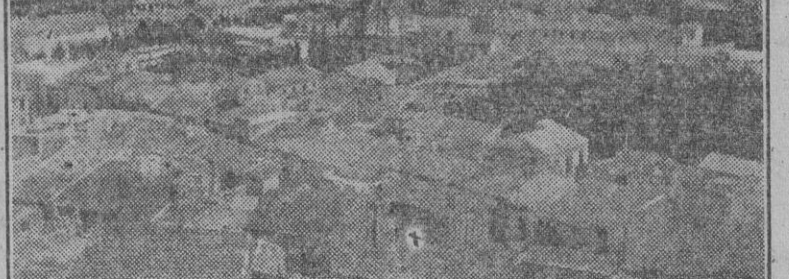
Vista parcial de Callosa de Segura.