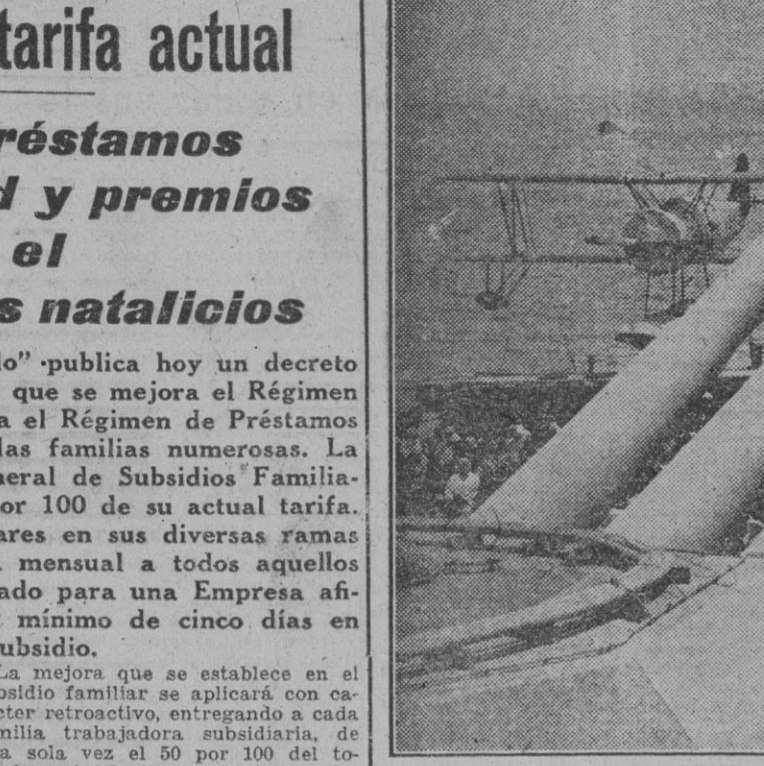
Sobre la cubierta de un barco de la Armada norte americana se han reunido numerosas personas para celebrar una fiesta. El escudillo hidroavión de la izquierda semeja una tímida libélula que ha venido a posarse sobre los tres imponentes cañones que apuntan amenazadores al horizonte.