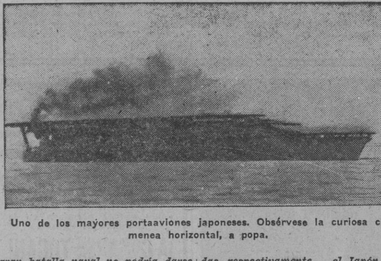
Uno de los mayores portaaviones japoneses. Obsérvese la curiosa chimenea horizontal, a popa.

Una simple título informativo español nos hace dudar de la fuerza de la Marina norteamericana, a la que verdaderamente hay que considerar en situación de fleet in being, por lo que los rumores de su actual contienda. La ayuda norteamericana llegará tarde para Inglaterra, o que no llegue nunca, esto es menos importante que el hecho cierto de que la existencia de esta potencia naval, veitibé por perspectivas incalculables a la guerra.