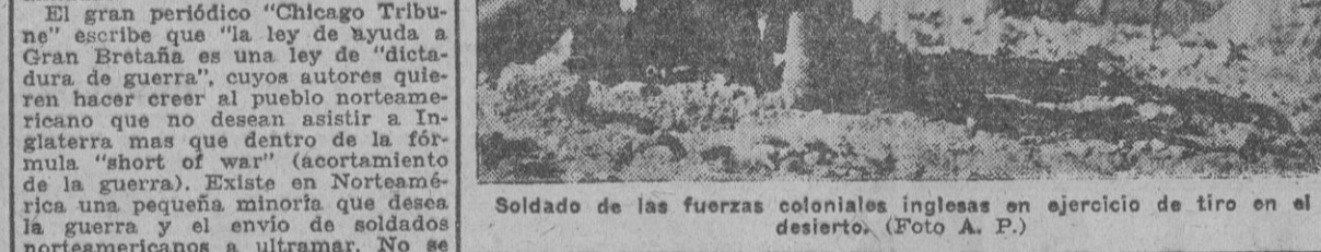
Soldado de las fuerzas coloniales inglesas en ejercicio de tiro en el desierto.