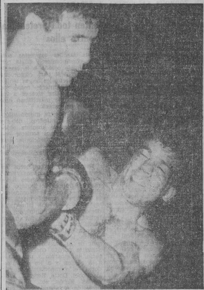
José Hernández acreditó sus justas aspiraciones, al conseguir un resultado nulo frente al campeón de Europa, Duilio Loi. El excelente esgrimista italiano pasó por momentos de apuro ante los constantes ataques del español. Sangrando por la ceja y la nariz, Loi obtuvo un veredicto que puede juzgarse como clemente. Hernández sigue teniendo la puerta abierta... En nuestra foto, Loi, a la derecha, acusa la fatiga en su rostro machacado por los puños del alicantino.