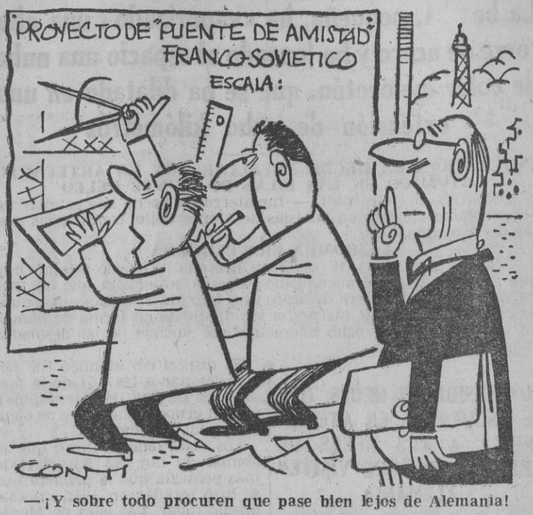
¡Y sobre todo procuren que pase bien lejos de Alemania!