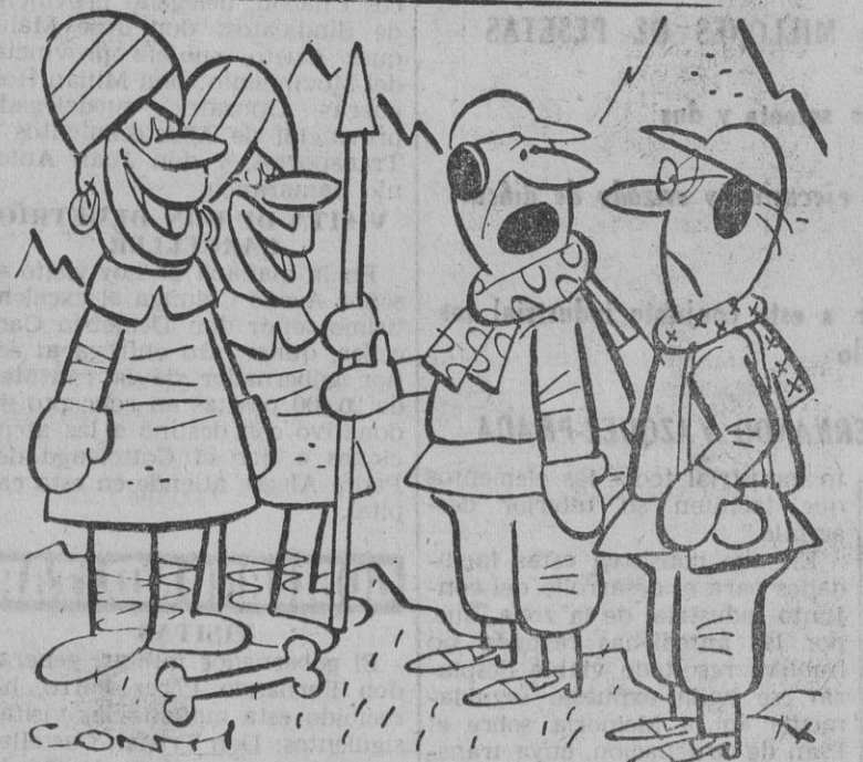
—¿Ha visto usted, profesor? Encontraron a un auténtico "hombre de las nieves". ¡Y se lo comieron!