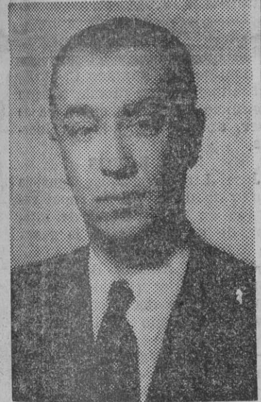
El presidente electo del Brasil, señor Juscelino Kubitschek, que mañana llegará a Madrid

RIO DE JANEIRO, 19. — Juscelino Kubitschek y Joao Goulart serán proclamados oficialmente nue-