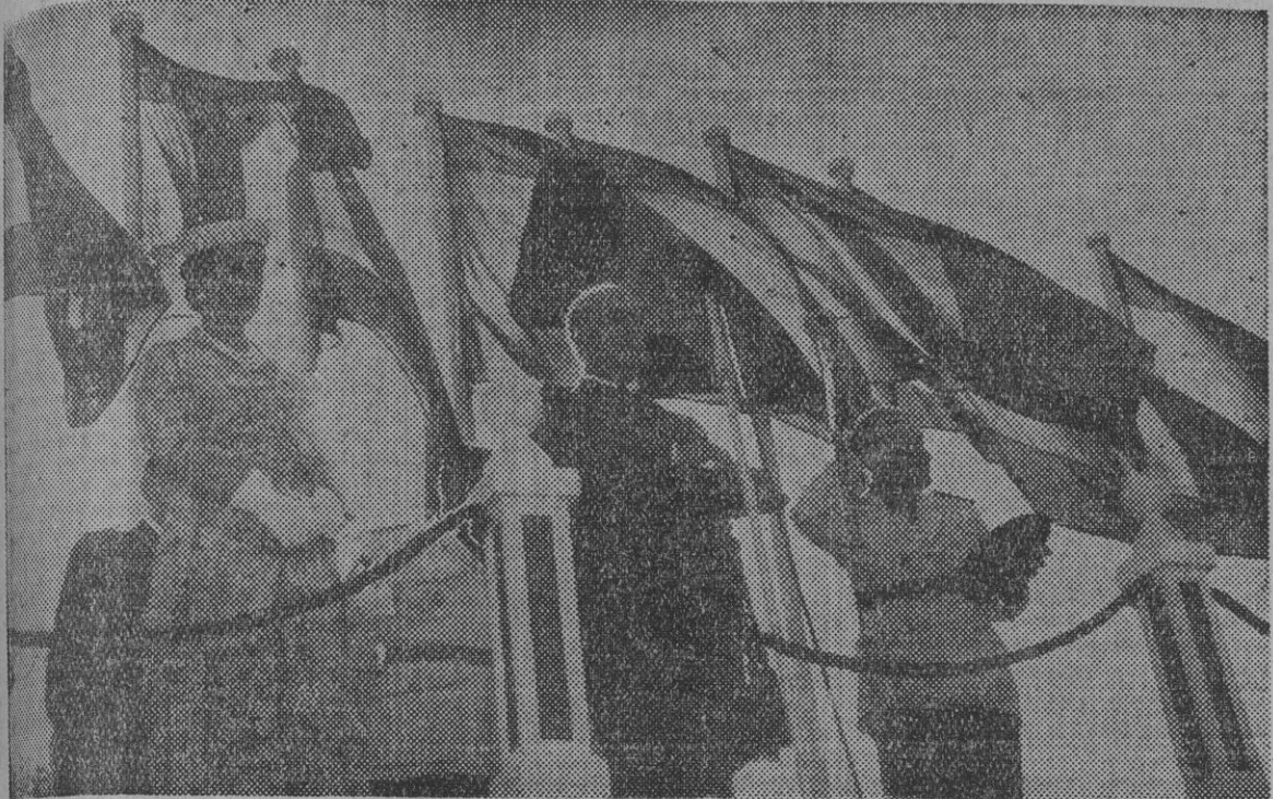
S. E. el Jefe del Estado, Generalísimo Franco, acompañado de su distinguida esposa y del ministro de Agricultura, señor Cavestany, presenciando, desde una tribuna, el recinto de la Feria Internacional del Campo, inaugurada por el Caudillo el sábado por la tarde en Madrid.

folclore y vestidos. Segulan los chistularis y spatazanaris de Bilbao, del siglo VIII. Y, tras ellos, Alemania, ceremoniosa en bailes y entonada en canciones; Ibiza, señorial; Suecia, Mallorca, Bretaña, Galicia, Portugal, Italia, Extremadura, Lugo, Le Nouc, Alava, RENFE de Madrid, Sabadell, Gales, Andorra, Canarias, Ucrania, Madrid, Figueras, Polonia,