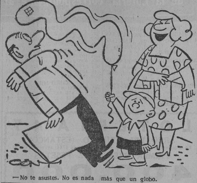
No te asustes. No es nada más que un globo.