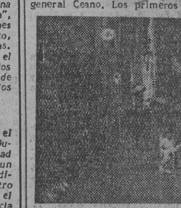
Un momento de la inauguración del X Congreso Nacional del Frente de Juventudes, bajo la presidencia del ministro secretario general del Movimiento, don Raimundo Fernández Cuesta, y con la asistencia del delegado nacional del F. de J. U., secretario de la misma Organización, delegado nacional del S. E. U. y otras jerarquías del Movimiento.

Discurso del ministro secretario general del Movimiento "No sólo es el Frente de Juventudes una de las obras predilectas de la Falange, sino una de sus creaciones indispensables". Señaló como misión fundamental de la juventud falangista, la de asegurar la continuidad del Movimiento, que exige que la línea doctrinal iniciada en 1933, siga inspirando la futura vida política española, enlazando cada vez más sus instituciones en la vida so-