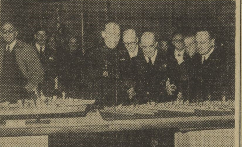
Con asistencia de los ministros de Marina y secretario general del Movimiento, así como otras altas y destacadas personalidades, se ha celebrado en el Museo de Arte Moderno de Madrid la inauguración de la I Exposición Nacional de Modelos Navales de las Falanges de Mar. La foto recoge un momento del acto.

Inauguración de la I Exposición Nacional de Modelos Navales de las Falanges de Mar