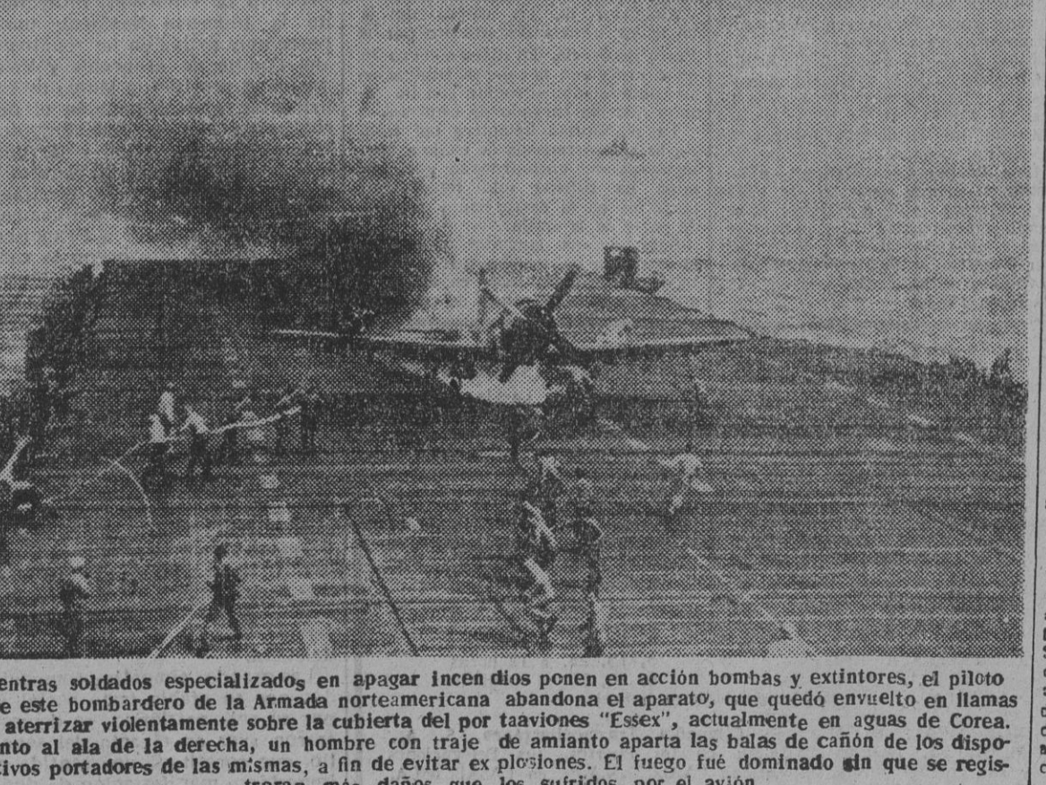
Mientras soldados especializados, en apagar incendios ponen en acción bombas y extintores, el piloto de este bombardero de la Armada norteamericana abandona el aparato, que quedó envuelto en llamas al aterrizar violentamente sobre la cubierta del portaaviones "Essex", actualmente en aguas de Corea. Junto al ala de la derecha, un hombre con traje de aluminio aparta las balas de cañón de los dispositivos portadores de las mismas, a fin de evitar explosiones. El fuego fue dominado sin que se registraran más daños que los sufridos por el avión