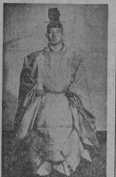
El príncipe Aki Hito, de 18 años de edad, después de la ceremonia en que fué proclamado heredero del trono japonés. En esta fotografía aparece con las milenarias ropas de ceremonia que constituyen la investidura de su nueva jerarquía. El acto tuvo lugar en el Palacio Imperial de Tokio

El príncipe heredero de Japón en traje tradicional