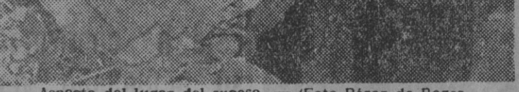
Aspecto del lugar del suceso.

Fuerzas de la Policía Armada y Guardia Urbana montaron cordones de seguridad para evitar que el público se acercara a la casa siniestrada.