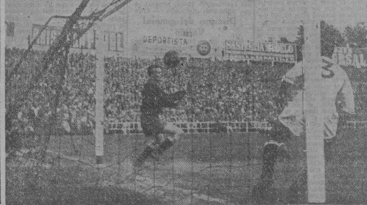
El cuarto gol sorprendió al nuevo meta del Sevilla.

Los partidos del domingo próximo son: Madrid-ESPAÑOL, BARCELONA-Málaga, Sevilla-Valencia, Celta-Valladolid, Real Sociedad-Atlético de Bilbao, Zaragoza-Coruña, Santander-Oviedo y Gijón-Atlético de Madrid.