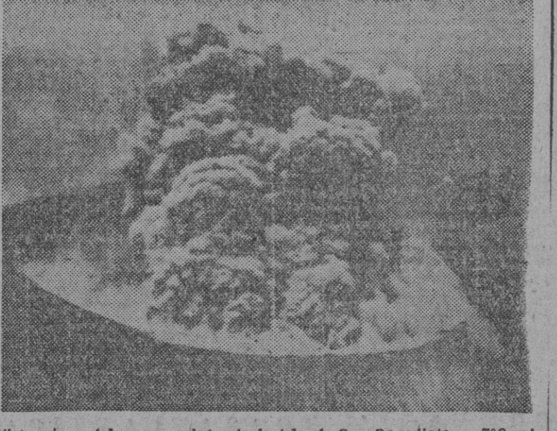
Vista aérea del nuevo volcán de la isla de San Benedito, a 780 millas al sur de San Diego (California). Entró en erupción lanzando una columna de humo gris durante veinte minutos. Seis semanas después había arrojado tal cantidad de lava, que el cono del volcán se alzaba a 1,050 pies sobre el nivel del mar y la isla era completamente inhabitable. La Marina de los Estados Unidos dice que es el más importante volcán de la cuenca del Pacífico al Este de Hawai en los tiempos históricos, y los científicos le atribuyen gran importancia como causa de transformaciones en la corteza terrestre.