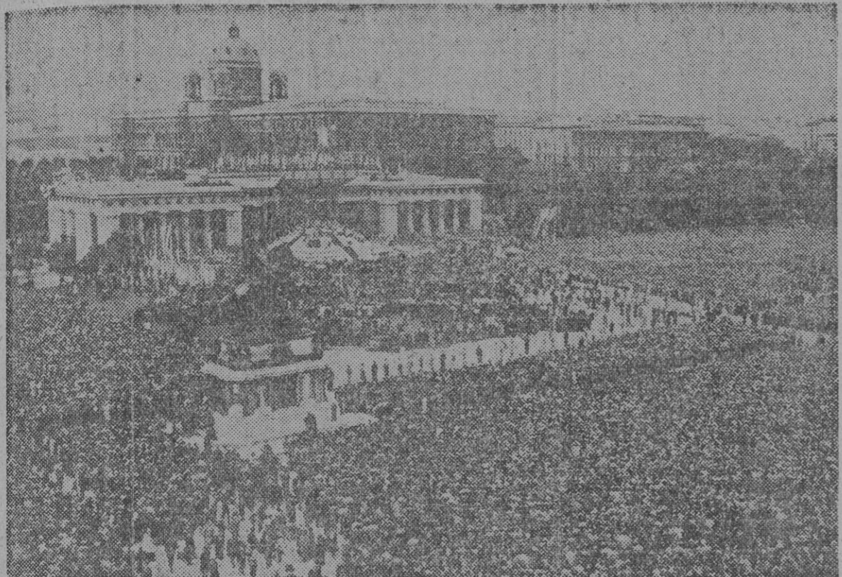
Más de 200,000 católicos abarrotaron la Heldenplatz (Plaza de los Héroes) vienesa el 14 de septiembre, con motivo del primer Congreso celebrado en la capital austriaca con el título de "Día Católico". En un altar erigido bajo el Arco de Triunfo de los Absburgo, ofició una misa el cardenal Dr. Innitzer, príncipe arzobispo de Viena y legado apostólico de Su Santidad para tal Congreso.