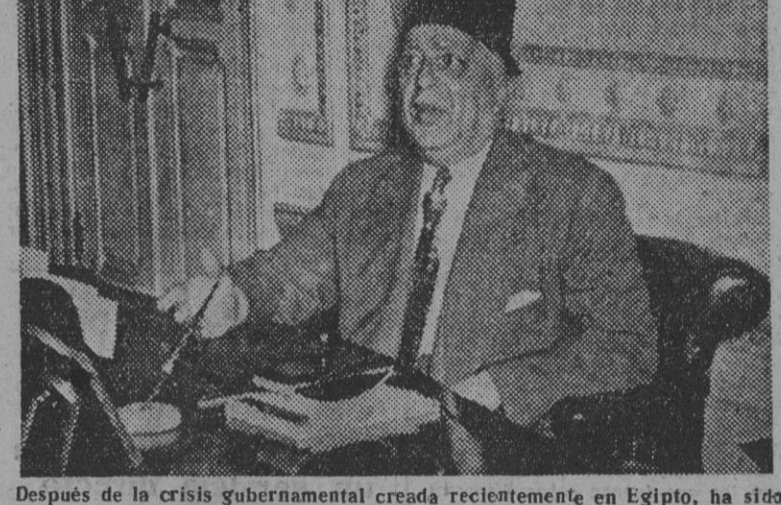
Después de la crisis gubernamental creada recientemente en Egipto, ha sido nombrado nuevo jefe del Gobierno, Hussein Sirry Pasha, que aparece en la presente fotografía tomada momentos después de hacerse cargo de la presidencia del Gobierno. Hussein Sirry Pasha, ha ocupado anteriormente en dos ocasiones, el puesto de primer magistrado de la nación egipcia.

Los asesinatos en masa de Katyn fueron cometidos por los rusos, según una investigación del Congreso norteamericano