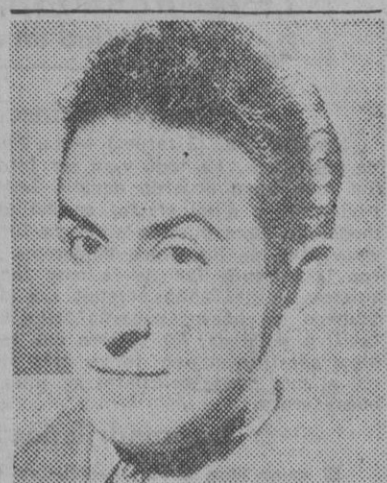
Figura de la escena