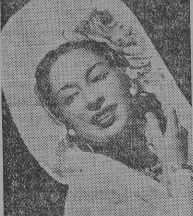
FIGURA DE LA DANZA

Esta película no se proyectará en ningún otro local durante la temporada