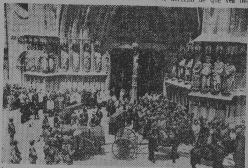
Los restos de los reyes de Aragón, colocados en varias cajas, son sacados de la Catedral de Tarragona para ser trasladados, en armonía de artillería, al Monasterio de Poblet