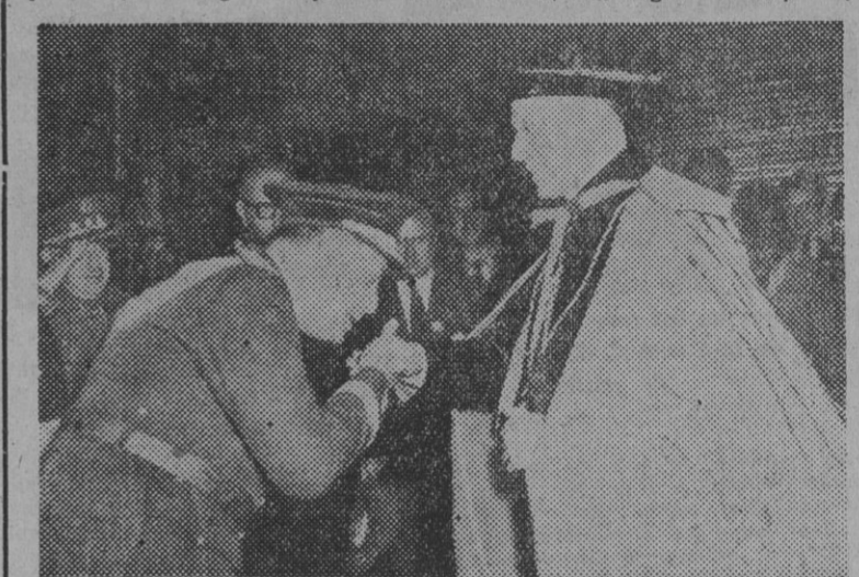
El ministro de la Gobernación, don Blas Pérez González, besa el anillo del cardenal Tedeschini, momentos antes de la salida del legado pontificio por la estación del Norte, camino de Salamanca

La estación terminal del Norte presentaba ayer un animadísimo aspecto ante el anuncio de la salida para Salamanca, desde donde proseguirá viaje a Irún, Francia e Italia, del cardenal legado, monseñor Tedeschini. Una hora antes de la salida del tren el vestíbulo y los andenes, que estaban profusamente adornados con banderas y gallardetes, estaba completamente lleno. Todo el trayecto por el que había de pasar Su Eminencia había sido alfombrado, desde la puerta de la estación hasta el pie del "break" de Obras Públicas y del que había sido destinado al cardenal legado.