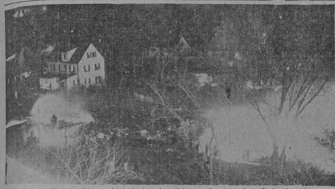
En esta fotografía, obtenida por la noche, pueden observarse los restos incendiados del avión que se estrelló contra un edificio de Elizabeth, Nueva Jersey (EE. UU.) el pasado día 11. De las 122 personas que viajaban en el avión sólo 14 sobrevivieron a la tragedia. En este mismo lugar se han registrado ya cuatro graves accidentes aéreos.