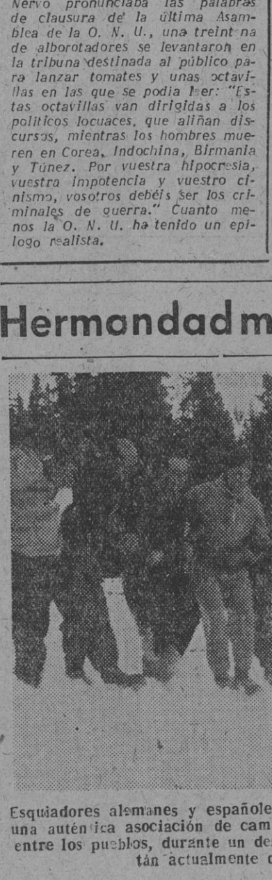
Esquiadores alemanes y españoles constituyen un simpático y alegre grupo, enlazando sus brazos en una auténtica asociación de camaradería y de la influencia del deporte en las relaciones amistosas entre los pueblos, durante un descanso en las pruebas de los Juegos Olímpicos de Invierno que se están actualmente desarrollando en Noruega.